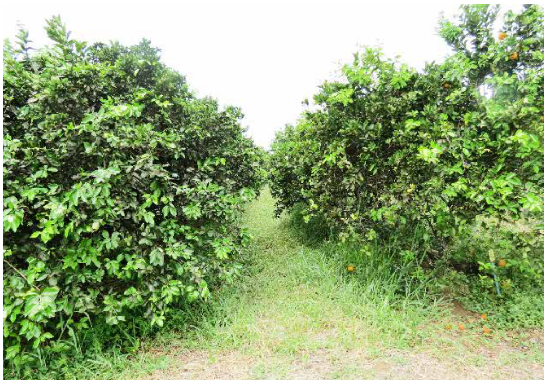
Figura 1.1. Vista parcial do Banco Ativo de Germoplasma de Citros da Embrapa Mandioca e Fruticultura em campo.