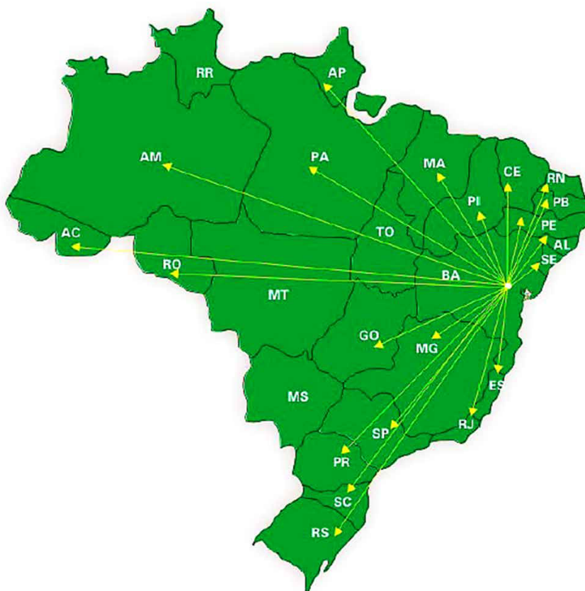
Figura 1.4. Distribuição de material básico de citros (mudas, borbulhas e sementes) da Embrapa Mandioca e Fruticultura para os estados brasileiros.