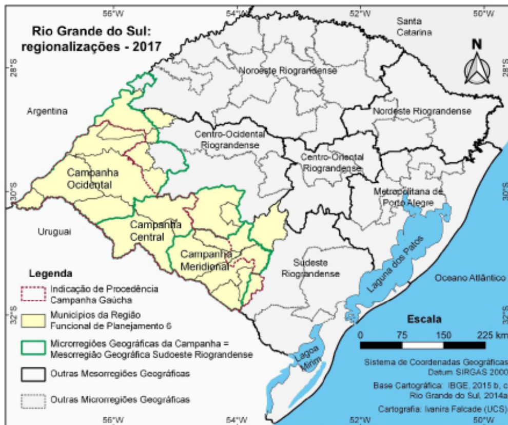
Figura 2.4. Mapa destacando a Indicação de Procedência Campanha Gaúcha no contexto de regionalizações do estado do Rio Grande do Sul, em vigor no Instituto Brasileiro de Geografia e Estatística (IBGE) e na Secretaria de Planejamento, Governança e Gestão (Seplog), em 2017.

A área geográfica delimitada da Indicação de Procedência Campanha Gaúcha é uma nova região (Figura 2.4), que também se localiza no oeste-sudoeste do Rio Grande do Sul, na faixa de fronteira do Brasil com o Uruguai e a Argentina, em contexto territorial semelhante às composições regionais referidas. Porém, a região da IP de vinhos é diferente, inclusive, do conjunto das microrregiões Campanha Ocidental, Central e Meridional ou da região Funcional de Planejamento 6, pois considerou os objetivos específicos de referir e representar o território do vinho da Campanha Gaúcha, tanto no âmbito nacional como internacional.