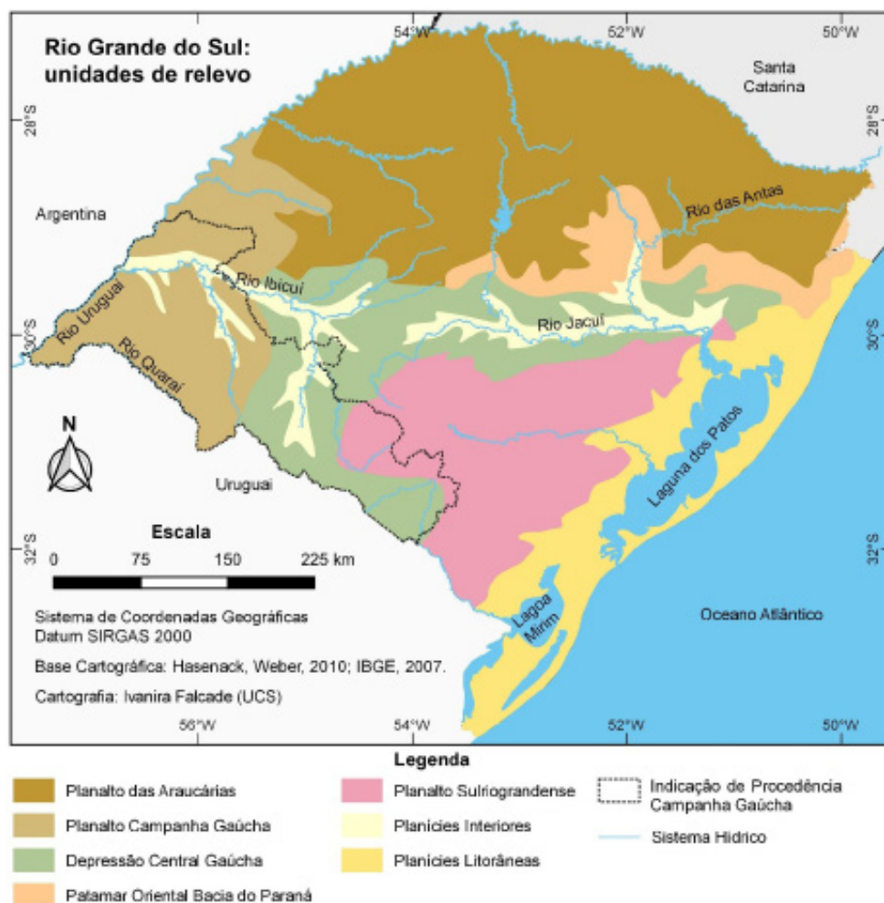
Figura 2.2. Mapa mostrando como a região da Indicação de Procedência Campanha Gaúcha se estende por diversas unidades geomorfológicas do Rio Grande do Sul.

A dinâmica geral da atmosfera na região recebe influência, principalmente, de três massas de ar (Figura 2.3): polar atlântica (fria e úmida), tropical atlântica (quente e úmida) e tropical continental (quente e seca), que desempenham papel preponderante na formação dos tipos climáticos predominantes com chuvas, sobretudo, frontais e efeito da continentalidade, com elevação da temperatura, nas áreas mais a oeste (IBGE, 1986; Maluf, 2000; Rossato, 2011). Essas massas de ar têm seu deslocamento influenciado pelas baixas altitudes e pelas grandes extensões e posições das formas de relevo da região.