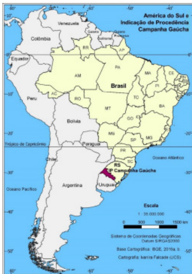
Figura 2.1. Mapa mostrando a localização da região da Indicação de Procedência Campanha Gaúcha em relação ao Brasil, aos países limítrofes, do Uruguai e Argentina, e à América do Sul.

A partir do século XVII, a região onde se localiza a IP Campanha Gaúcha e o Rio Grande do Sul foi palco de muitas batalhas, nas disputas entre as metrópoles espanhola e portuguesa,