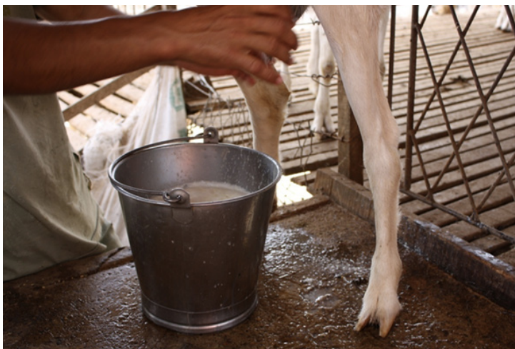
Figura 7. Leite de cabra com mastite provocada por Mycoplasma agalactiae .