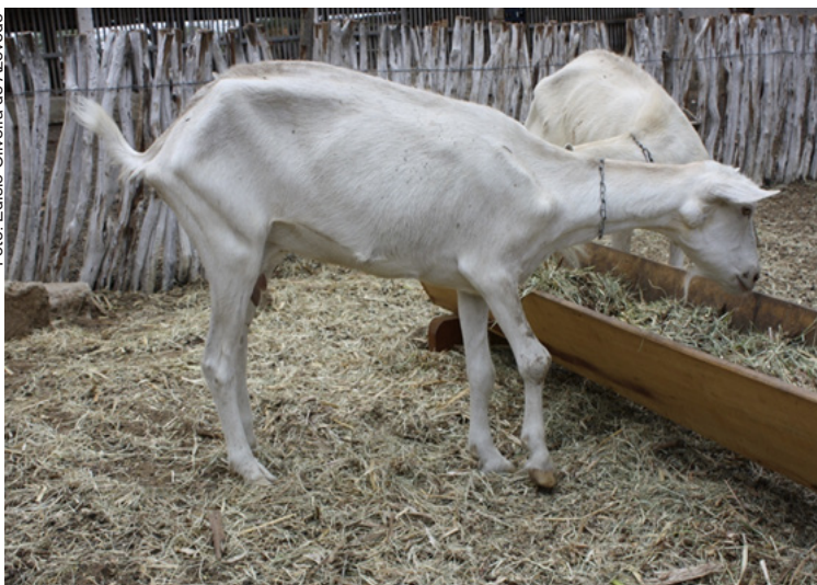
Figura 8. Cabra com poliartrite provocada pela micoplasmose.