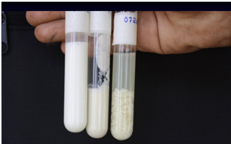
Figura 9. Amostras de leite normal (esquerda), com poucos grumos (centro) e com muito grumos (direita). Amostra do centro e da direita de animais com micoplasmose.

Todo o procedimento de coleta de amostras, envio ao laboratório de diagnóstico, cultivo e identificação, normalmente demanda um longo período de tempo para conclusão do diagnóstico, permitindo a permanência de animais infectados no rebanho facilitando a disseminação do agente para outros animais. A diferenciação das espécies por meio de métodos sorológicos pode ser utilizada. No entanto, em algumas situações existe a necessidade de comprovação por meio de técnicas mais específicas, devido à presença de reações cruzadas entre amostras ou mesmo por variações no tamanho e expressão antigênica das proteínas de superfície da amostra (Rosengarten; Yogev, 1996). Outra desvantagem dos métodos sorológicos é a necessidade de diferentes tipos de soros para se estabelecer a comparação frente ao antígeno que se deseja identificar, o que dificulta seu emprego na rotina diagnóstica.