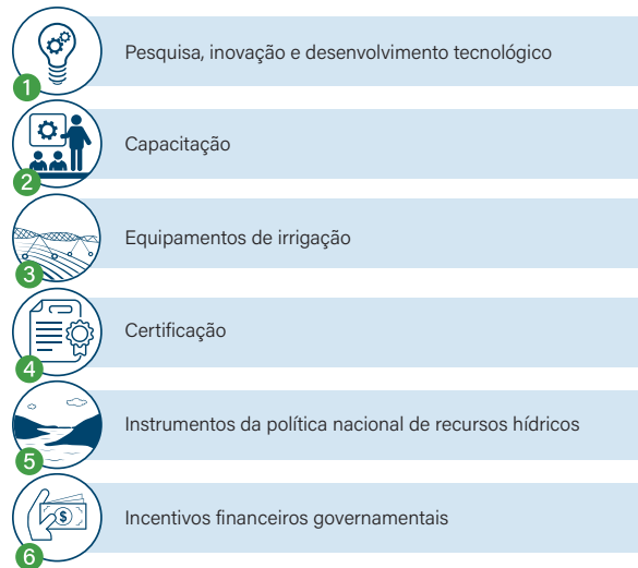
Figura 1. Temas considerados essenciais ao desenvolvimento de estratégias de uso eficiente da água na agricultura irrigada.

Seis temas considerados essenciais ao desenvolvimento de estratégias de uso eficiente da água na agricultura irrigada foram trabalhados durante o Workshop Uso Eficiente da Água na Agricultura Irrigada, Subsídios para Formulação de Programas de Incentivo Técnico 2 (Figura 1). Uma síntese dos resultados e das conclusões do referido workshop são apresentados na sequência.