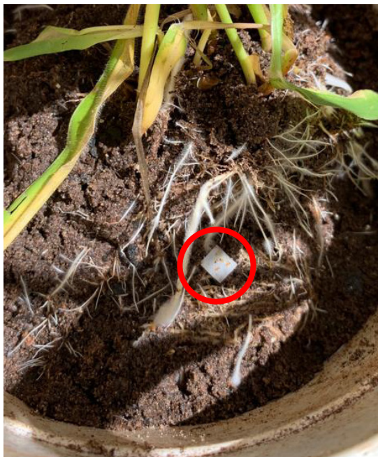
Figura 2. Vaso infestado com ovos de Notozulia entreariana .