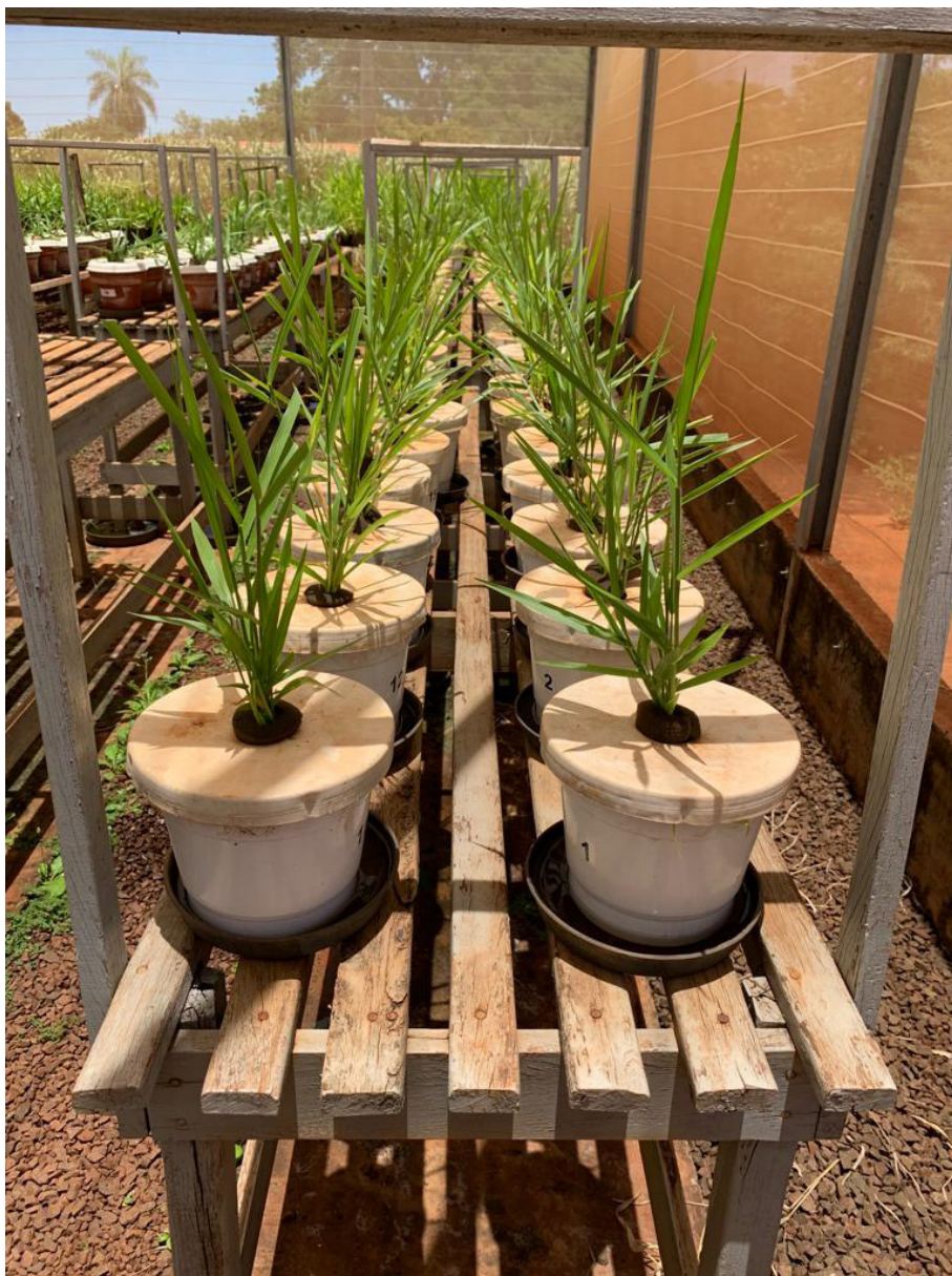
Figura 1. Vasos preparados para infestação.