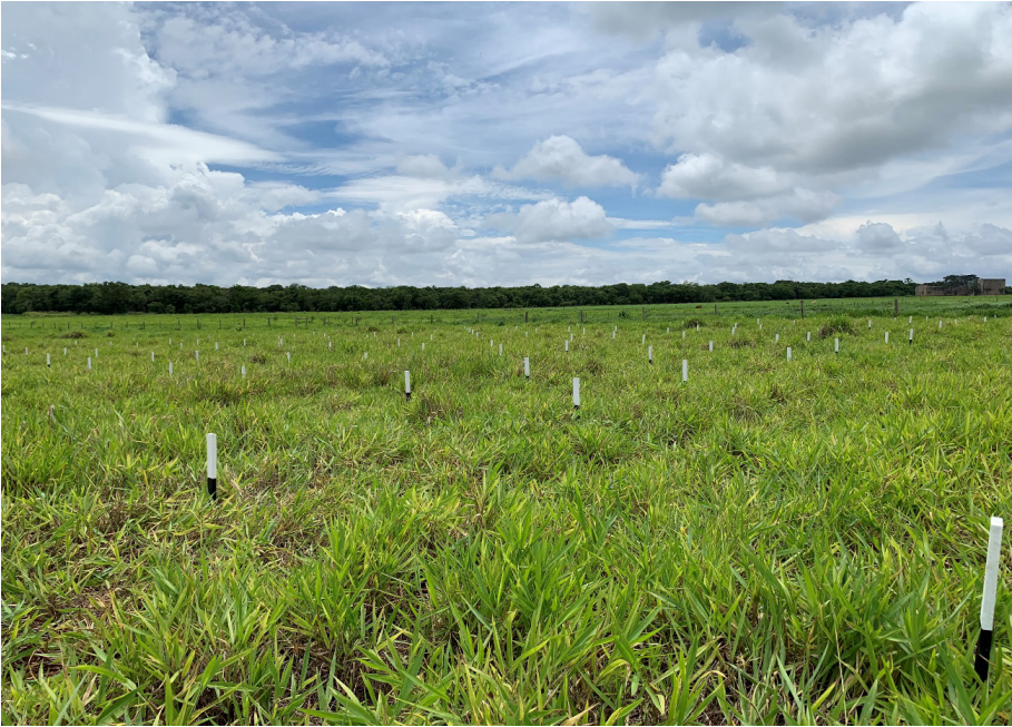
Figura 4. Experimento demarcado.

Ao serem constatadas espumas bem formadas na base das plantas (espumas contendo ninfas de 2º ou 3º instar), foi realizada uma amostragem. Para tal, lançou-se um quadrado metálico de 0,25 m de lado, aleatoriamente, dentro da parcela experimental. Contou-se o número de espumas nas bases das touceiras das plantas dentro do quadrado amostral. Foram contabilizadas as espumas em dois pontos amostrais por parcela. O centro do quadrado foi demarcado com estacas de metal, para que nas próximas amostragens o quadrado fosse disposto no mesmo local para contagem das espumas remanescentes após aplicação dos tratamentos.