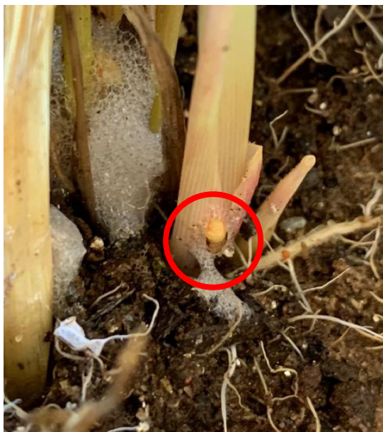
Figura 3. Ninfã fora da espuma após aplicação de desalojante.