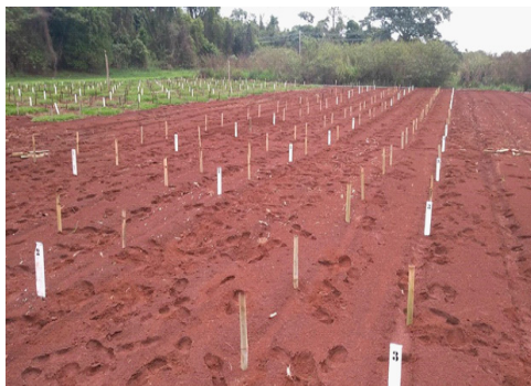
Figura 2. Demarcação das parcelas com estacas de madeira.