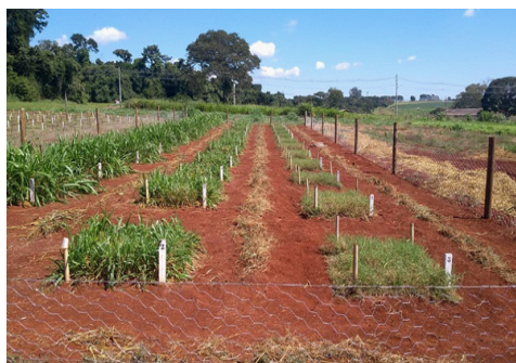
Figura 3. Manejo de capina dos corredores entre as parcelas.