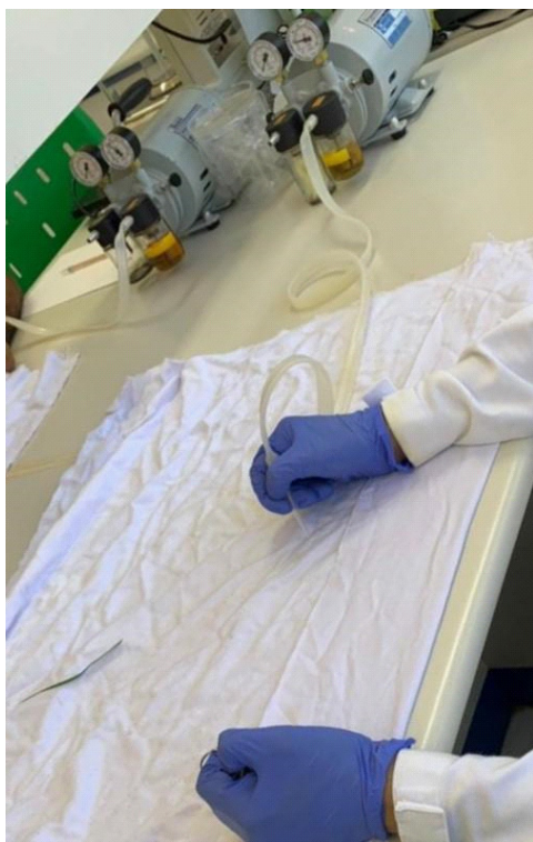
Figura 7. Contagem manual das larvas utilizando bomba a vácuo.