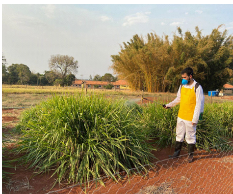
Figura 5. Pulverização cronometrada das parcelas do controle negativo (água) utilizando bomba costal elétrica.