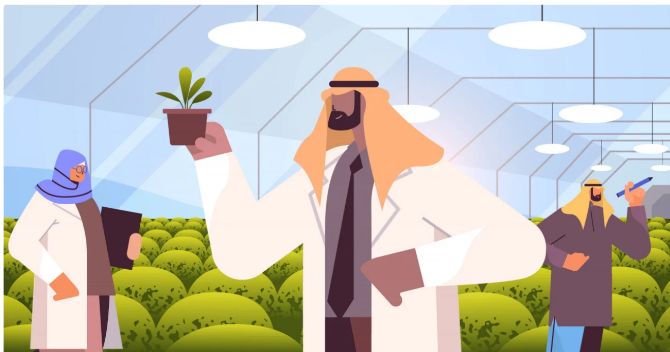
Árabes na agricultura