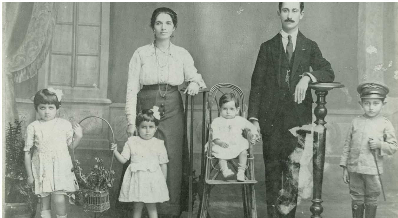
Imigrantes árabes no Brasil

imigrantes de diversas nacionalidades da Europa e do Oriente, e foram a base da nova agricultura e agroindústria. Até a expansão recente do agronegócio no Centro-Oeste e Matopiba resulta de seus descendentes.