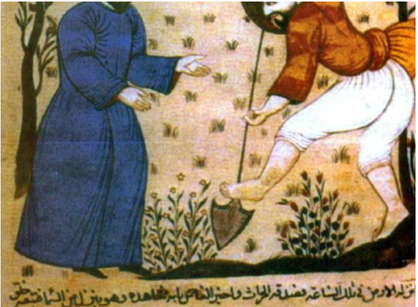
Ibn Al Awan: o pai da agronomia e da veterinária

O Livro da Agricultura , escrito por Ibn Al Awan, é um verdadeiro tratado de agronomia, com cerca de 1.500 páginas. Seus 35 capítulos, em três volumes, apresentam os resultados de uma revisão bibliográfica mais completa possível dos autores gregos, latinos, egípcios, caldeus, persas e nabateus, confrontada a experimentos realizados em residências, campos e palácios dos califas em Granada e Sevilha. Esses locais funcionavam como “jardins de ensaios”. E os resultados eram avaliados com uma “estatística” básica, apoiada em ábacos. No Marrocos, Ibn Al Awan dá nome a uma revista de pesquisa agrônômica, Al Awamia , análoga à Bragantia , do Instituto Agrônomo de Campinas.