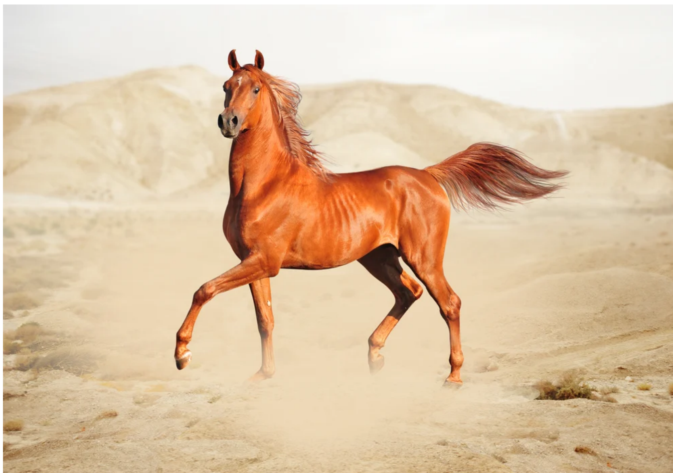
Cavalo árabe de raça pura

Com exceção de suínos, todos os animais domésticos foram estudados por Ibn Al Awan, segundo uma lógica constante: escolha dos animais, seleção, reprodução, estabulação e confinamento, alimentação e aspectos sanitários. Os cavalos, paixão conhecida dos árabes, estão em um tomo inteiro da obra. Entre vários temas técnicos, ele trata de 112 enfermidades e apresenta receitas de mais de 20 colírios para cavalos ( sic! ). O título desse capítulo: “Tratamento de algumas das doenças que sobrevêm aos cavalos nas diversas partes do corpo. (...) Sintomas e diagnósticos para as doenças; remédios. Esta parte da ciência é a medicina veterinária ”. A última parte de seu livro sobre avicultura aborda a incubação artificial de ovos e, no sentido amplo, trata da criação de pombos, galinhas, pavões, patos e gansos. Um artigo ensina a fabricação de foie gras . E dedica o último à apicultura.