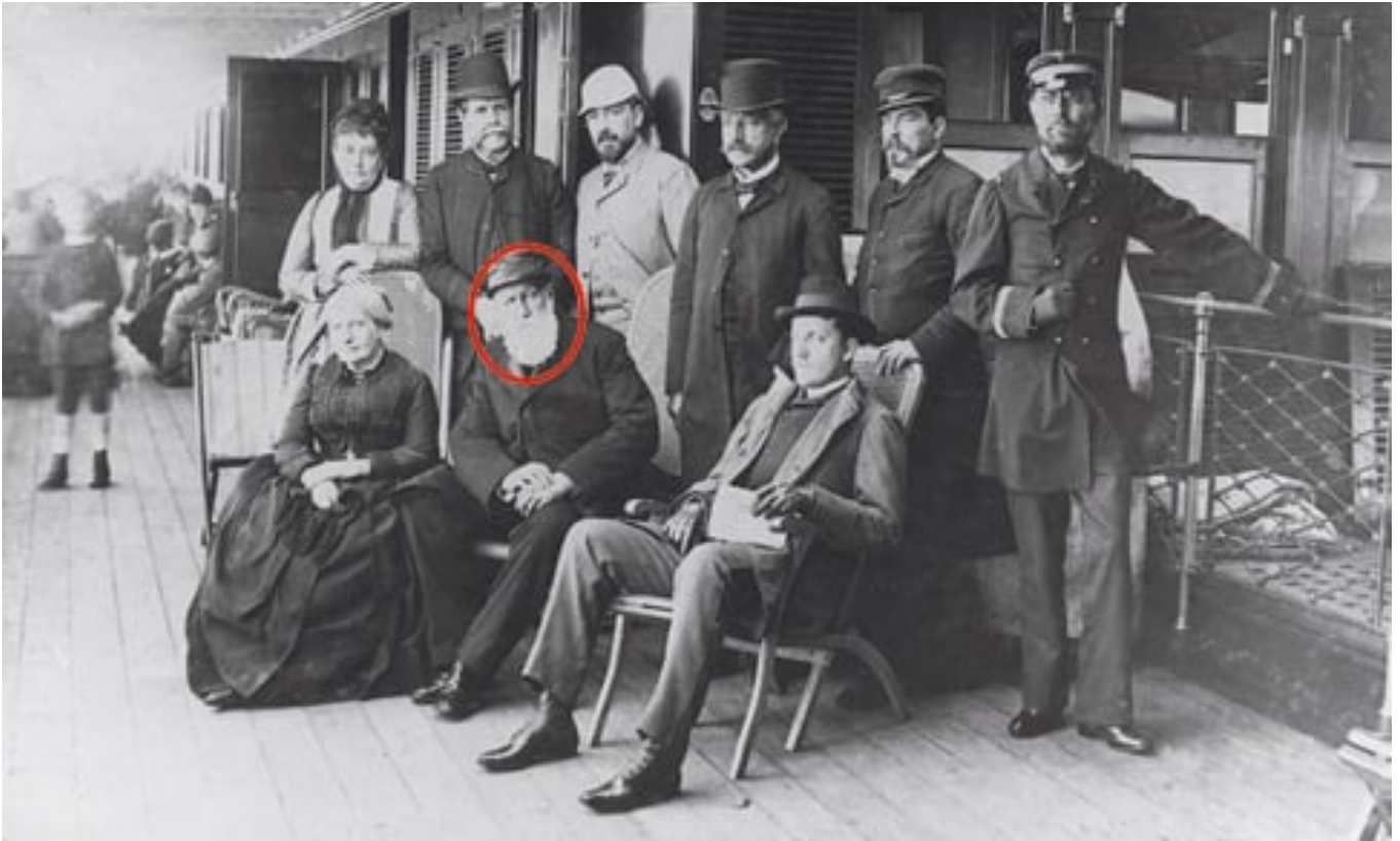
Dom Pedro II, em viagem ao Líbano

Os escritos de Dom Pedro II expressam sua visão de estadista ao buscar desenvolver no Brasil outra agricultura, diferente daquela baseada em trabalho escravo, cana-de-açúcar, tabaco e café. Defendia uma agricultura familiar, análoga à existente na Europa, mas com características do empreendedorismo da norte-americana. Ele estabeleceu contatos e acordos com monarquias de Prússia, Áustria, Rússia, Polônia e até do Japão para favorecer a vinda de agricultores ao Brasil.