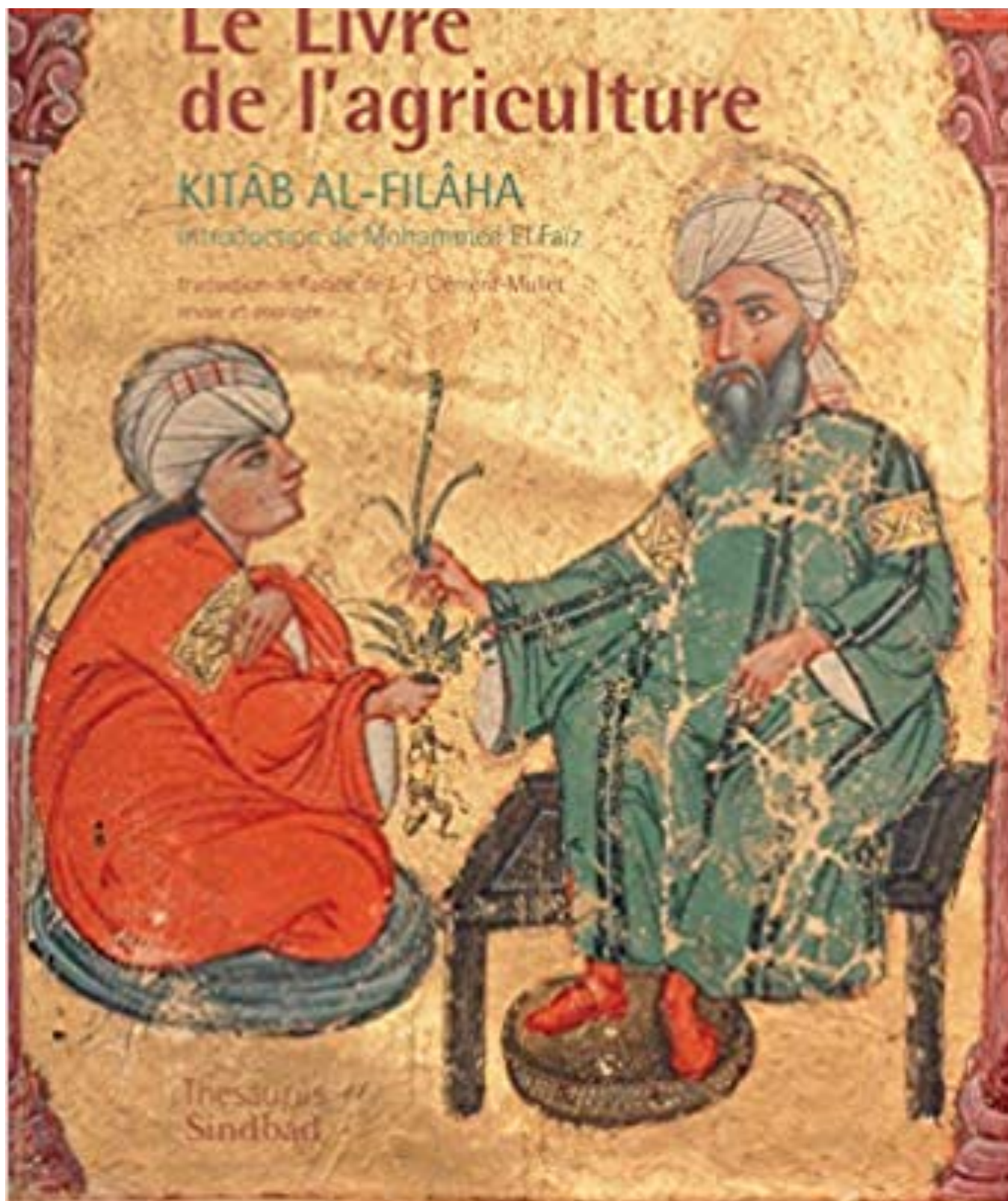
O Livro da Agricultura

Sua obra detalha o cultivo de 151 espécies de árvores abordando técnicas de propagação, meios de multiplicação, plantação, condução, poda, enxertia e tratamentos fitossanitários. E distingue a reprodução sexuada nas árvores. O capítulo XIII se intitula Fecundação Artificial das Árvores.