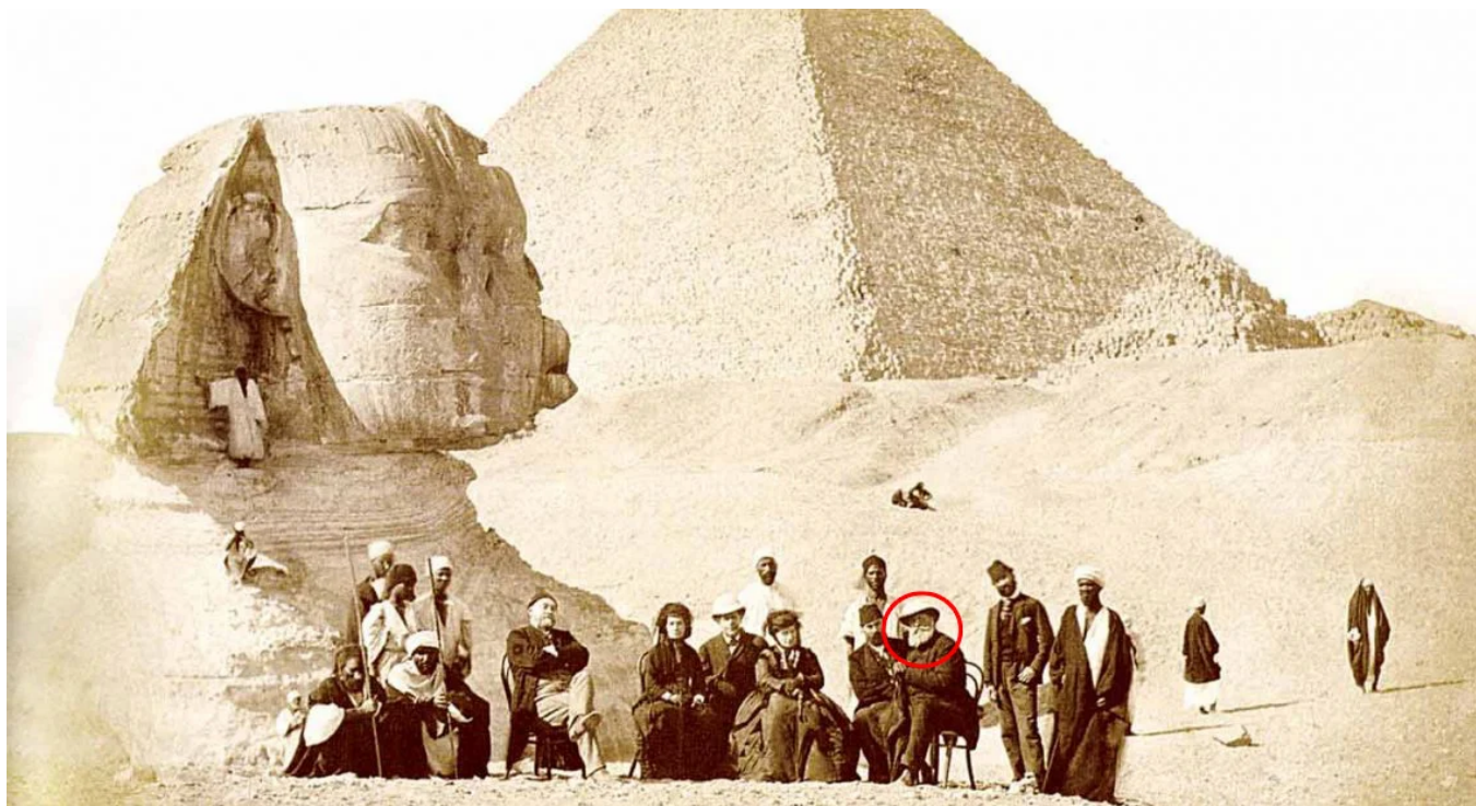
Em 1872, o imperador Dom Pedro II (no detalhe) e sua comitiva, em frente à Pirâmide de Gizé

falava árabe. E deixou um grande legado de sua viagem ao Oriente Médio: incentivou e organizou a imigração árabe ao Brasil.