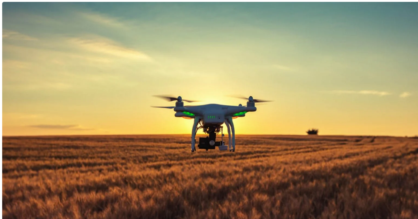
Drone sobrevoa campo