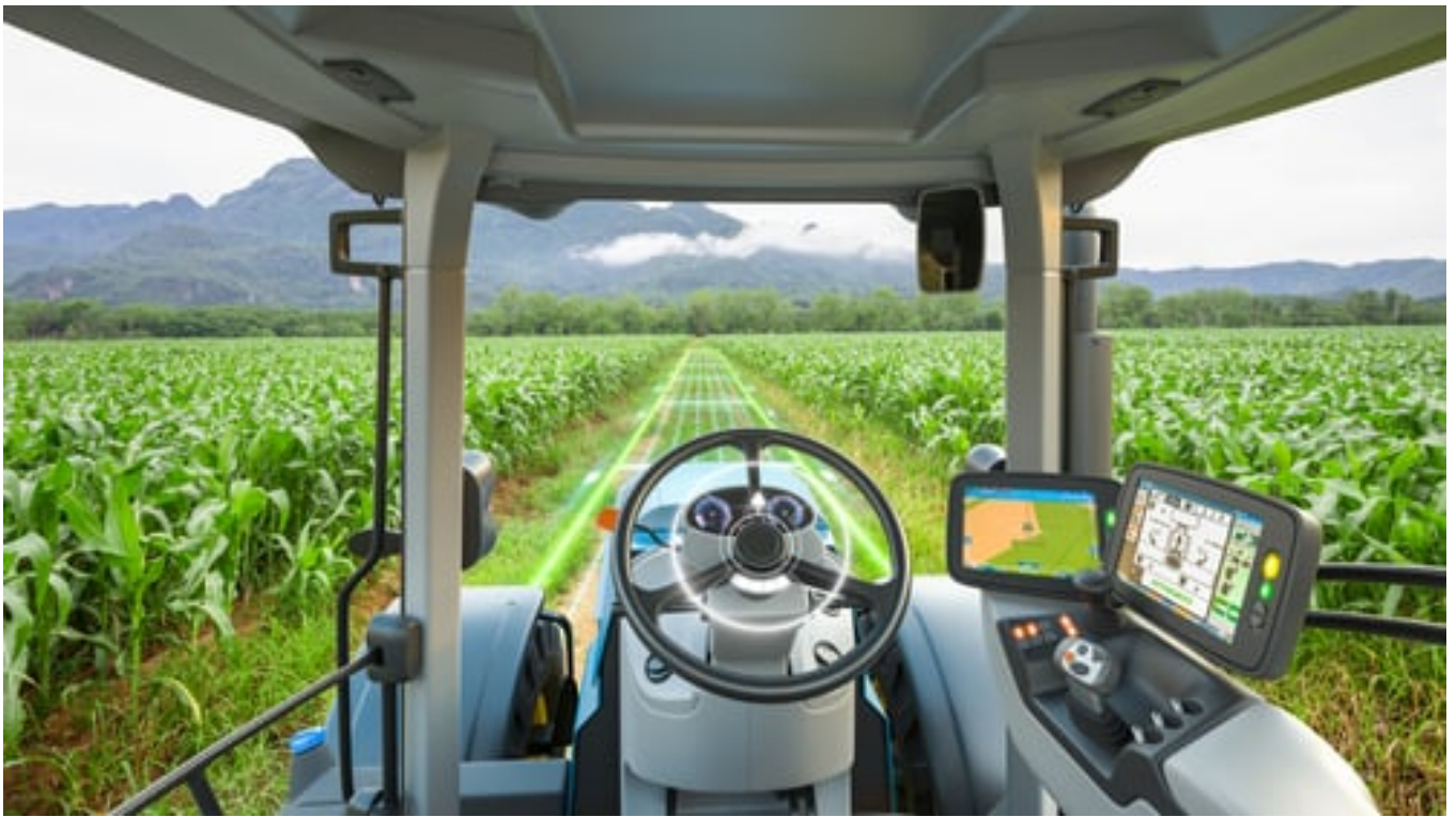
Trator usando GPS no campo

Há duas ou três décadas, a informática entrou nas fazendas pelos escritórios. Computadores usados na gestão contábil e financeira chegaram à parte técnica e operacional. Agora, a computação está nas máquinas, no campo e nos estábulos. Na produção de mangas em Petrolina, cada árvore tem seu código de barras. E há um chip ou brinco eletrônico em cada animal de tantos rebanhos bovinos espalhados pelo Brasil.