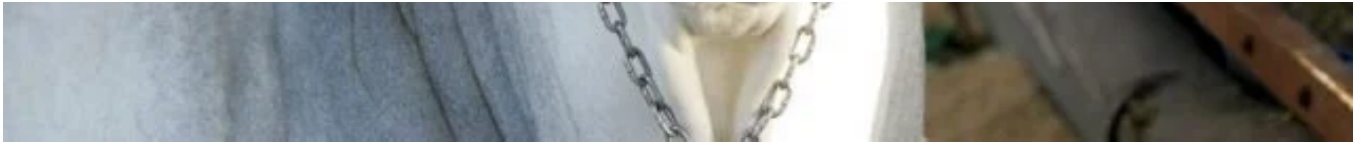
Boi com um brinco eletrônico

Drones e geotecnologias criaram um novo campo na implantação e na análise das lavouras. Eles detectam pragas e doenças, falhas de plantio, excesso de irrigação, problemas nutricionais, emergência de plantas daninhas, graças a softwares de análise das imagens captadas. Outros drones são utilizados em operações agrícolas: semeaduras, pulverizações de agroquímicos, liberação de agentes de controle biológico, acompanhamento de áreas florestais, monitoramento de rebanhos à distância etc. O custo-benefício dessa ferramenta é excelente e, em parte, substitui até a aviação agrícola.