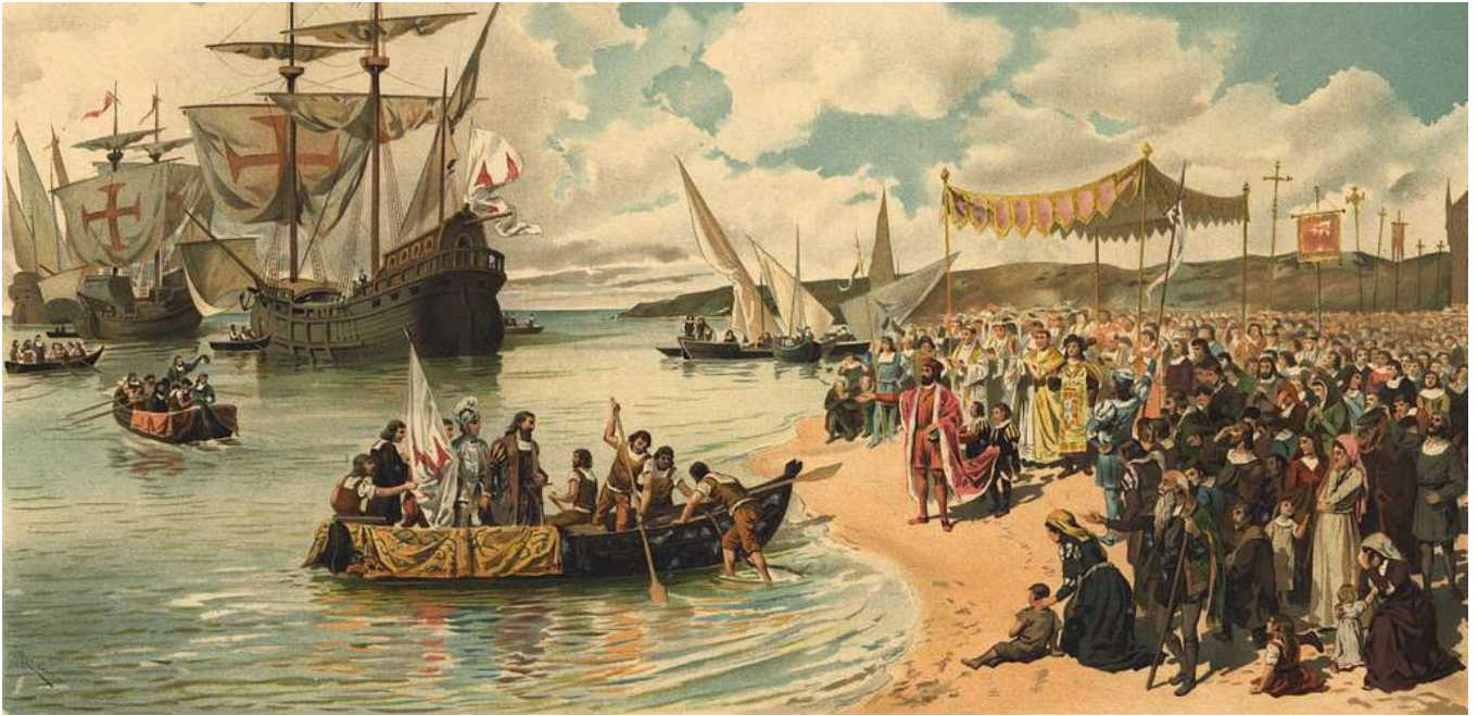
A partida de Vasco da Gama para a Índia em 1497

O aforismo de Pompeu tomou outro sentido com as navegações ultramarinas portuguesas. Nos regimentos das naus, ele evocava o início da navegação de precisão. De lá para cá, o navegar é preciso. Ainda mais nos dias atuais, com os satélites GPS. Já o viver dos homens nunca foi preciso. E nunca será. Para os cosmógrafos nas caravelas, navegar era preciso. Viver, não: ataques, doenças, naufrágios e fados.