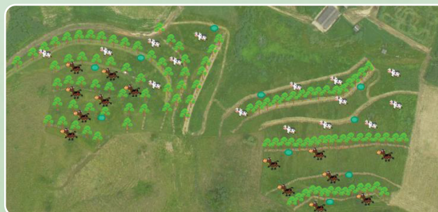
Desbaste sistemático de plantas alternadas (esq.); Desbaste sistemático de linhas alternadas (dir.)