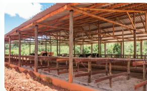
Postes, construções rurais, etc.