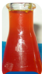
Óleo de polpa