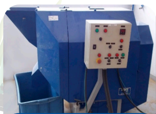
Secagem em secador rotativo