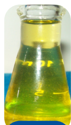
Óleo de amêndoa