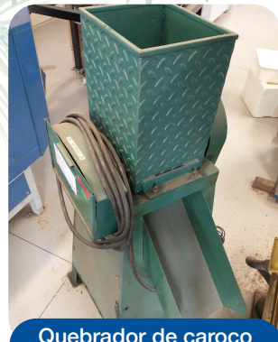
Quebrador de caroço (bilro)