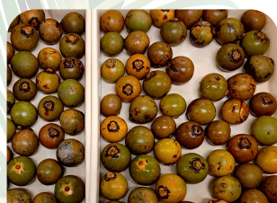
Frutos selecionados e limpos