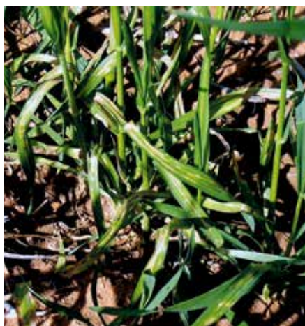
A deficiência de nutrientes pode influenciar na reação das plantas à infecção por patógenos

destacar que o Cl desempenha papel relacionado à manutenção de níveis de salinidade de planta, e um estresse causado pelo seu desequilíbrio reduziria a tolerância aos patógenos.