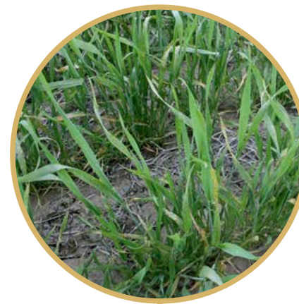
Deficiência de P