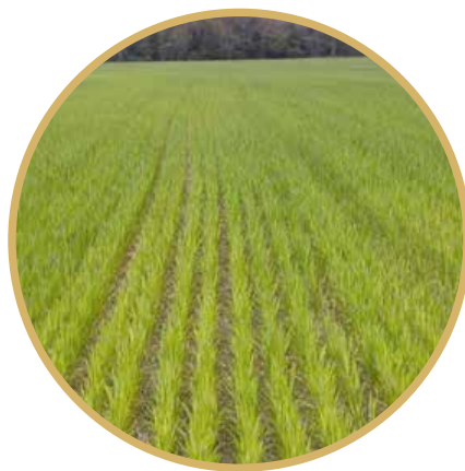
Deficiência de S