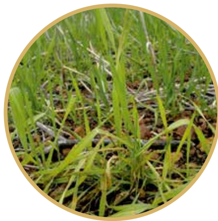
Deficiência de Zn

doenças. Existe diferença em relação à forma de aplicação, como no caso das podridões de raiz de trigo causadas por Fusarium spp. , em que, na forma de \text{NO}_3^- , atua diminuindo o ataque do patógeno, e na forma \text{NH}_4^+ , age de forma contrária. Quanto às doenças foliares em trigo, a adubação nitrogenada em doses elevadas aumenta a suscetibilidade das plantas, como observado no complexo