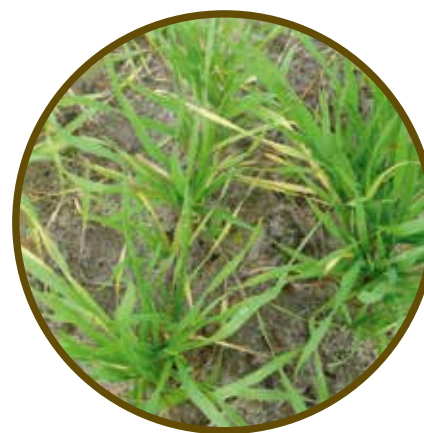
Deficiência de N