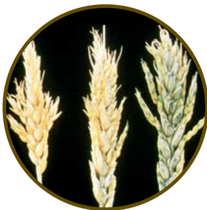
Deficiência de B