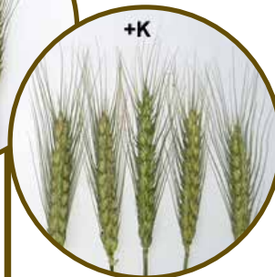
Deficiência de K