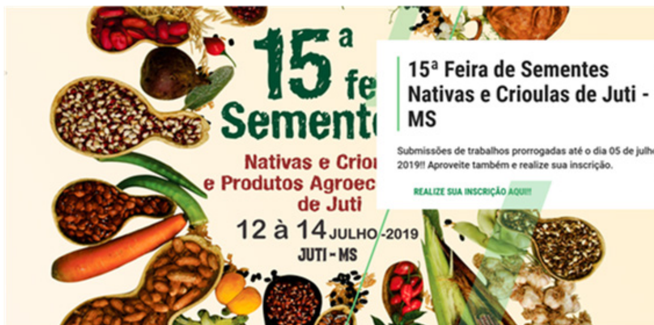
Figura 3. Feira de Sementes Crioulas – material de divulgação

restauração ecológica em paisagens degradadas e análise e promoção da conservação de recursos genéticos por comunidades locais e agricultores. O fortalecimento das estratégias de conservação on farm em diversas regiões brasileiras depende do esforço conjunto de agricultores familiares, povos indígenas e comunidades tradicionais, por meio dos bancos e casas de sementes, das feiras de sementes (Figura 3) e dos guardiões da agrobiodiversidade (Medeiros et al., 2018).