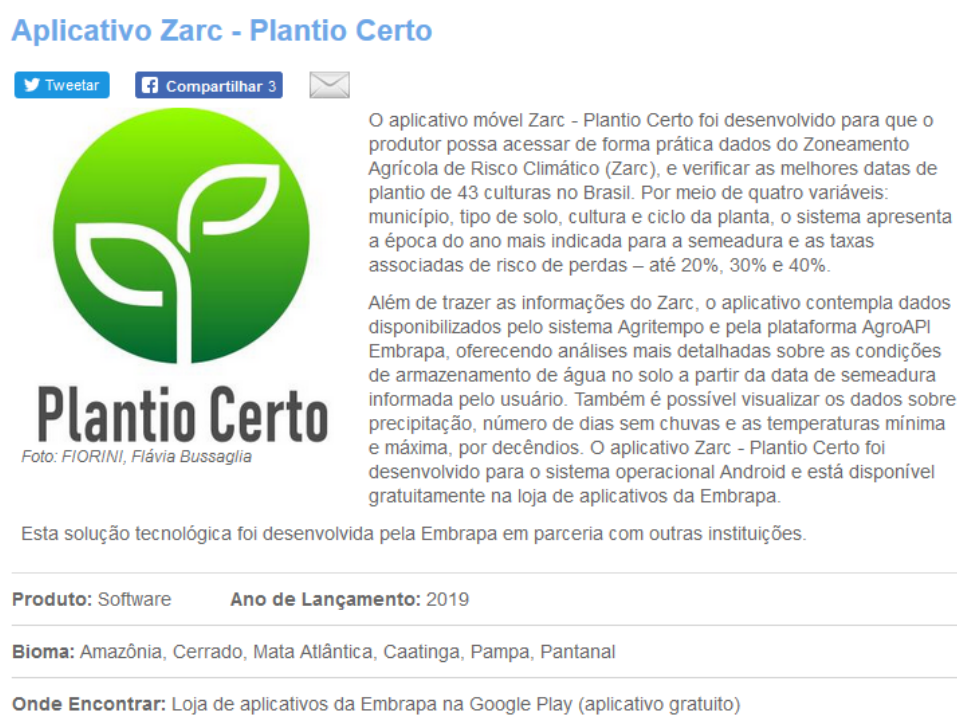
Figura 1. Aplicativo lançado pela Embrapa e parceiros para disseminar informações de zoneamento agrícola de risco climático.

O zoneamento é mais uma ferramenta que auxilia o produtor a aproveitar melhor as condições locais para ter sucesso na atividade rural. Esta tecnologia envolve a indicação de datas ou períodos de plantio e de semeadura por cultura e por município, considerando as características do clima, o tipo de solo e ciclo de cultivares, de forma a evitar que adversidades climáticas coincidam com as fases mais sensíveis das culturas, minimizando as perdas agrícolas. Um aplicativo foi disponibilizado para uso no celular (Figura 1), de modo a melhorar a interface produtor-recomendações de plantio (Galinari, 2019).