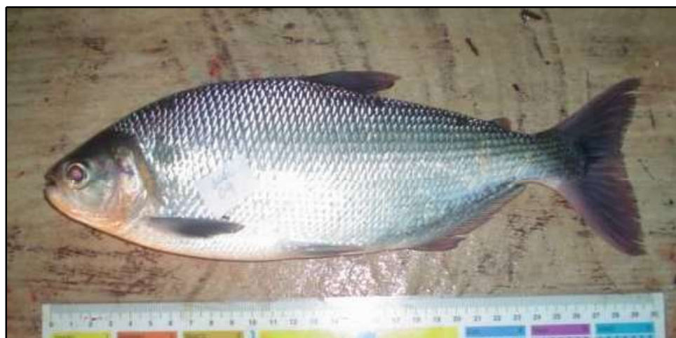
Figura 1. Espécime de Brycon amazonicus cultivado em canal de igarapé do Tarumã-Mirim, Manaus (AM).

Brycon cephalus Günther, 1869 (Figura 1) sinônimo de B. erythropterum Cope, 1872 ainda é uma espécie válida, mas sua distribuição geográfica é restrita à região do alto Rio Amazonas, sendo encontrado principalmente na Bolívia e no Peru. Os exemplares que foram anteriormente citados na região da Amazônia central foram identificados erroneamente, e serão considerados como B. amazonicus . Todas as citações de parasitos para aquelas espécies serão consideradas como parasitos de B. amazonicus .