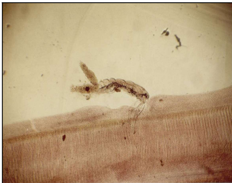
Figura 3. Filamento branquial de matrinxã B. amazonicus , parasitado

Os danos causados por E. bryconis às brânquias dos matrinxãs foram: infiltração de células, especialmente leucócitos; hiperplasia epitelial, proliferação de células epiteliais; metaplasia epitelial, transformação de células epiteliais em células mucosas; fusão de lamelas e destruição da capa epitelial do filamento. Estas reações ocorreram tanto na área de penetração das antenas, como à altura da boca, de onde o parasito retirava seu alimento (Figura 3) (Varella, 1985).