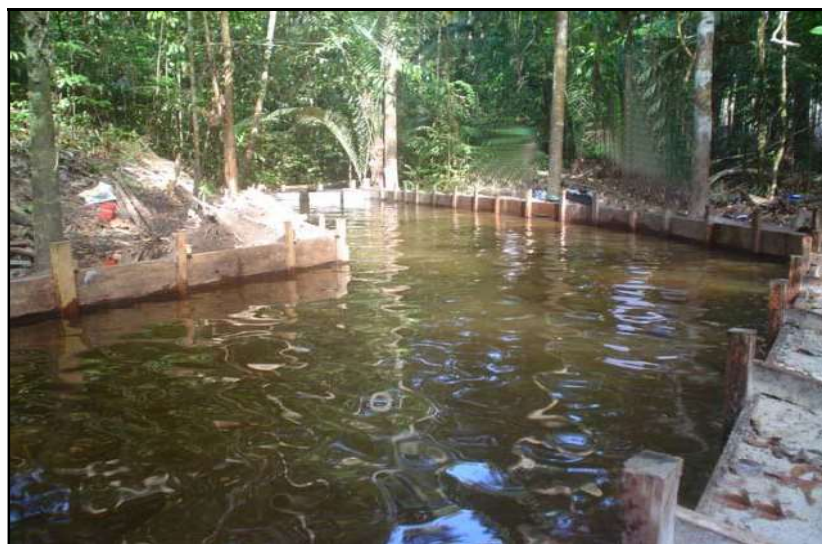
Figura 4. Vista geral de um canal de igarapé construído na região do Rio Tarumã-Mirim, Manaus (AM) para cultivo de B. amazonicus .

No estado do Amazonas, uma forma recente de cultivo intensivo de B. amazonicus é a criação em canais de igarapé (Figura 4). Essa modalidade foi introduzida pelo Programa de Criação Intensiva de Matrinxãs em Canais de Igarapé (PROCIMA/INPA) em comunidades assistidas pelo programa de assentamentos do Instituto Nacional de Colonização e da Reforma Agrária (INCRA), como importante alternativa proteíca. No estado, esse tipo de criação sustentável foi implantado em dois municípios (Manaus e Presidente Figueiredo) favorecidos pela grande abundância de igarapés. Neste tipo de criatório, as paredes do igarapé são alargadas e reforçadas com telas plásticas e/ou sacos de rafia cheios (mistura de areia com cimento) e com madeiras da própria região, o excesso de areia e matéria orgânica também são removidos do leito. O trecho do igarapé passa então a medir aproximadamente 20 m de comprimento, 4 m de largura e 75 cm de profundidade. Além disso, na parte inicial do sistema também é construído um "reservatório" com queda de água contínua para o canal de igarapé. Assim, esse sistema de criação se assemelha ao sistema de cultivo norte-americano conhecido como "raceways".