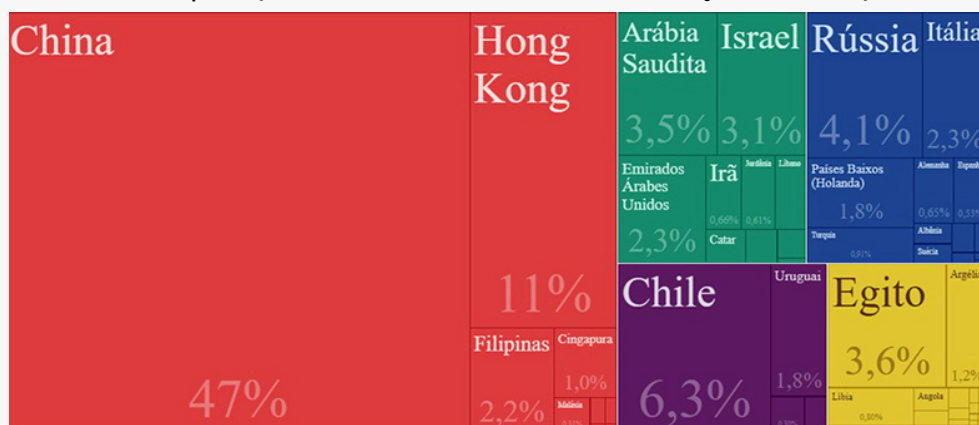
Destinos das exportações brasileiras de carne bovina entre janeiro e março de 2020