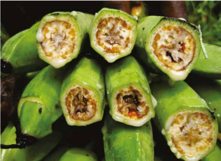
Figura 4. Frutos com sintoma típico de BXW. Apodrecimento e descoloração interna da polpa, variando de marrom a preto.