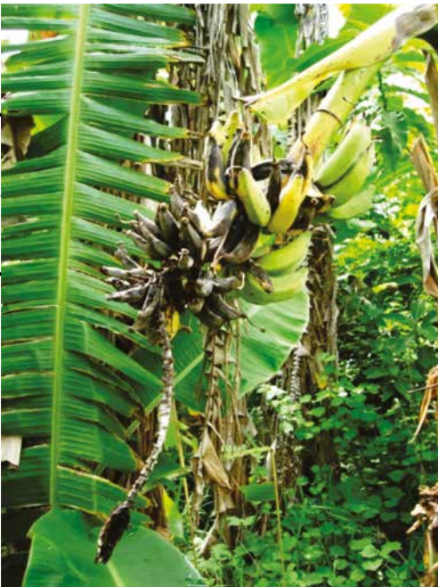
Figura 5. Sintomas de BXW em frutos. Frutos apodrecidos permanecem aderidos ao cacho.