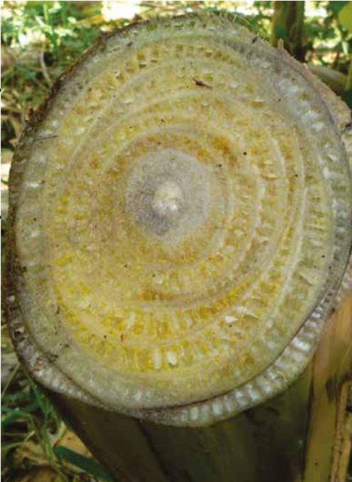
Figura 7. Pseudocaulo de bananeira com amarelecimento dos feixes vasculares, exceto o cilindro central. Sintomas característicos da infecção por meio de ferimentos no rizoma, pseudocaulo, folha ou via sistêmica, a partir da planta-mãe infectada.