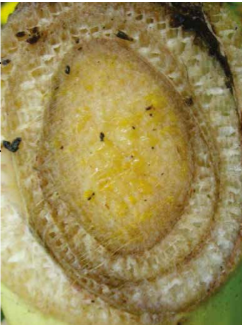
Figura 8. Pseudocaulo de bananeira com amarelecimento do cilindro central. Sintoma característico da infecção via inflorescência.