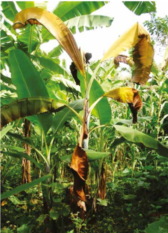
Figura 2. Sintomas de BXW bananeira infectada antes do florescimento. Murcha e amarelecimento da folha com quebra da nervura central.