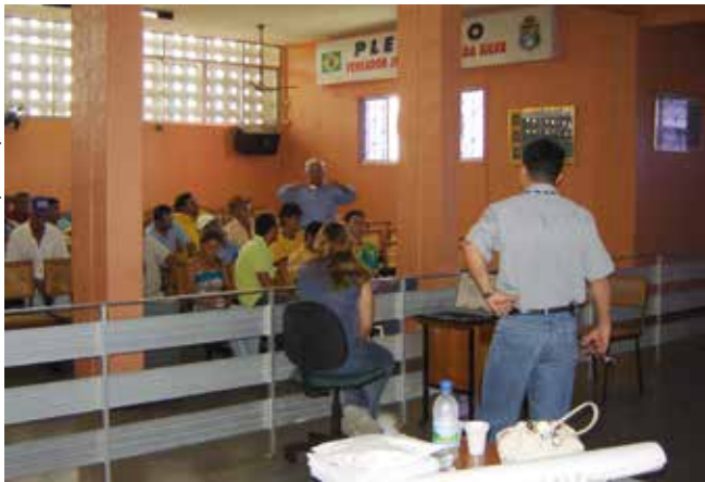
Figura 1. Reunião organizada pela Prefeitura de Morada Nova, na Assembleia Legislativa do município, a fim de tratar do tema Conservação e Melhoramento Genético. Na foto, um dos criadores questiona o pesquisador da Embrapa: “E agora, doutor? Como vocês da Embrapa podem contribuir?”.

A proposta foi prontamente aceita por todos e uma nova reunião foi agendada para ocorrer na propriedade de um dos criadores. O pesquisador só fez uma exigência: como a Embrapa Caprinos e Ovinos até então não contava com recursos para seu deslocamento e permanência em Morada Nova, era necessário um aporte financeiro para o custeio de seu traslado, hospedagem e alimentação. Essa exigência foi prontamente acatada pela Prefeitura de Morada Nova, que se comprometeu a arcar inicialmente com essas despesas.