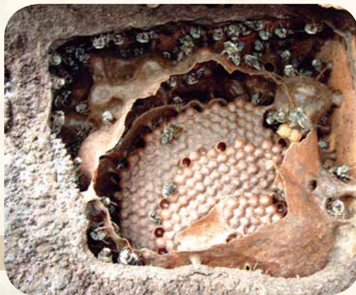
Figura 7: Batume delimitando a área do ninho de tiuba Melipona fasciculata

O ninho pode ser envolvido com uma estrutura porosa denominada Batume (Figura 7). Com a função de vedar frestas e delimitar áreas, o batume pode ser construído de cerume, resina, barro, fibras vegetais, látex, sementes e até excremento animal. O mel de espécies de abelhas que constroem o ninho usando excremento animal não é próprio para o consumo in natura .