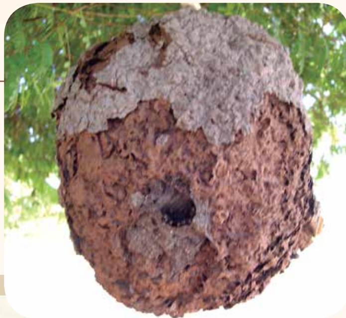
Figura 2: Colônia de cupira ( Partamona sp.) em cupim

Os ninhos das abelhas-sem-ferrão são, em geral, construídos em ocos de árvores, ninhos abandonados de cupins e formigas, fendas em rochas, cavidades de solo ou, ainda, em ninhos expostos (Figura 2). Nessa construção, as abelhas usam cera, resina, barro e cerume (uma mistura de cera com resina).