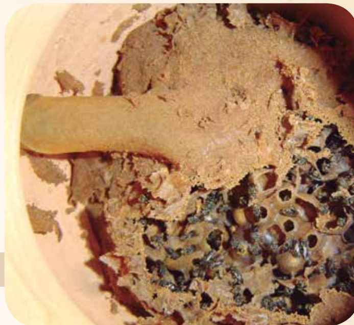
Figura 4: Tubo de entrada interno em ninho de iraiá ( Nannotrigona testaceicornis )

A ligação entre a área interna e a entrada da colônia é usualmente feita por um tubo construído de cerume, resina ou barro. Esse tubo pode terminar na área de cria ou de alimento e auxilia na defesa da colônia contra invasores (Figura 4).