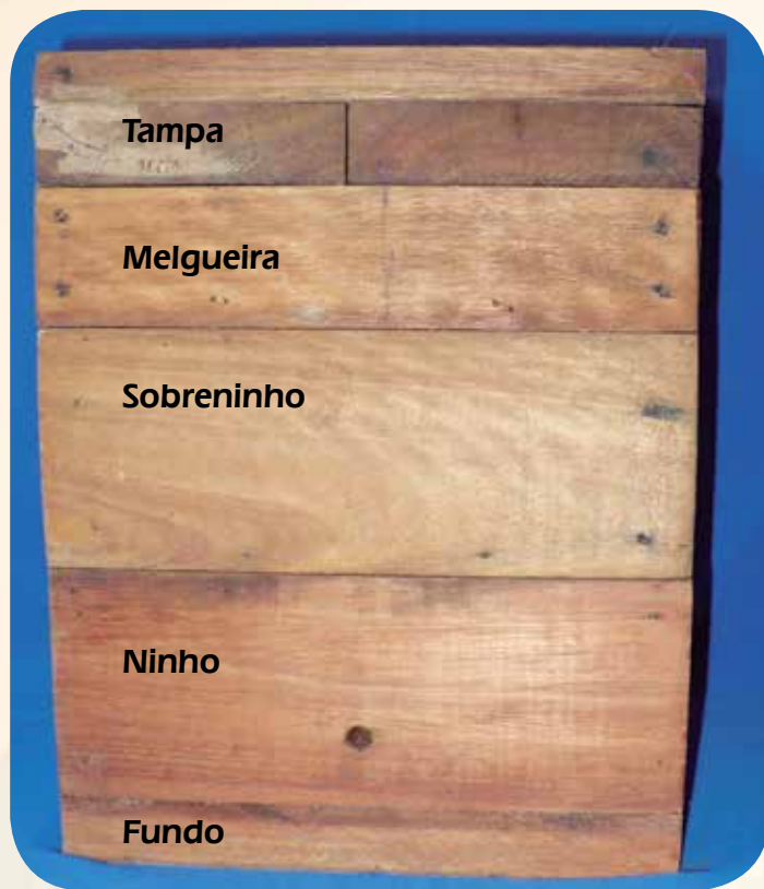
Figura 12: Colmeia para abelha-sem-ferrão modular, modelo INPA