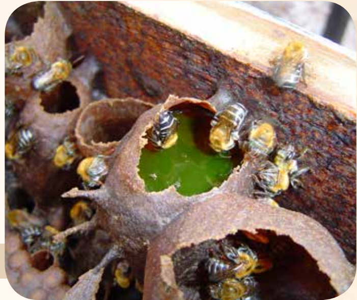
Figura 8: Potes de alimento em colônia de urucu Melipona scutellaris

O alimento é armazenado em potes circulares ou ovais (Figura 8). Construídos de cerume, ficam dispostos ao redor da área de cria. O tamanho dos potes varia de acordo com a espécie; em geral, as espécies de abelhas maiores constroem potes com tamanho maior.