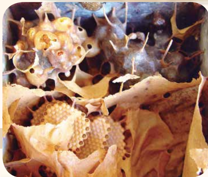
Figura 6: Discos de cria envolvidos por invólucro em colônia de abelha-mosquito Plebeia sp.

A área de cria pode estar envolta pelo invólucro, lâminas de cerume, que auxiliam na proteção da cria e manutenção da temperatura (Figura 6).