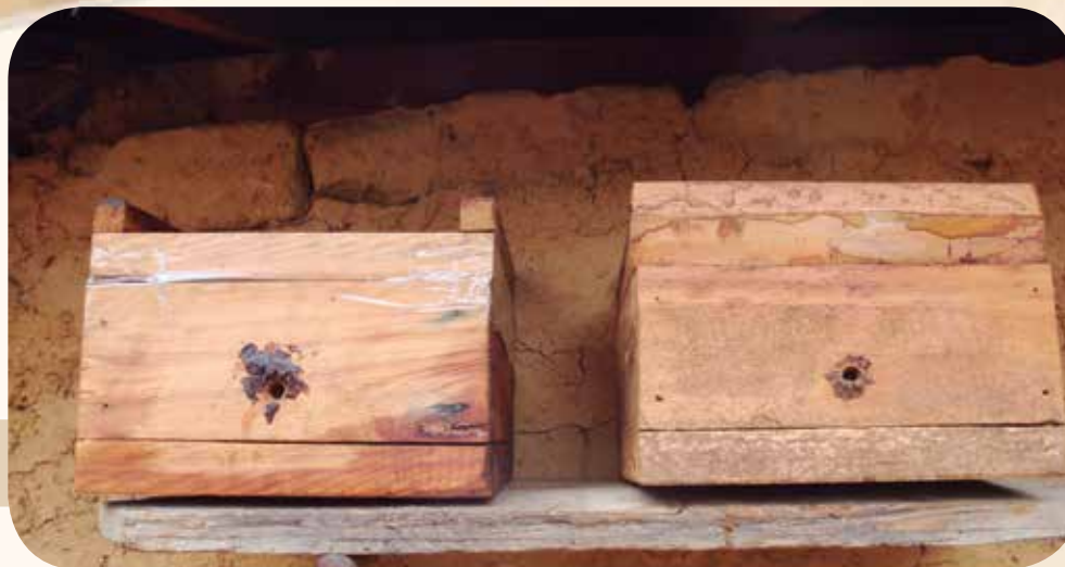
Figura 1: Criação racional de abelhas-sem-ferrão