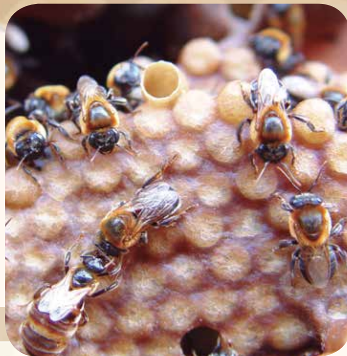
Figura 9: Rainha de jandaíra, Melipona subnitida , sendo alimentada por operária

As operárias são responsáveis por praticamente todo trabalho dentro da colônia: construção das células de cria e potes de alimento, limpeza, produção de cera, coleta de néctar, pólen, resina, barro, etc. Os machos são menores que as operárias e podem apresentar em sua face uma mancha clara. A função do macho é reprodutiva. Entretanto, em algumas espécies, os machos podem produzir cera e regular a temperatura do ninho.