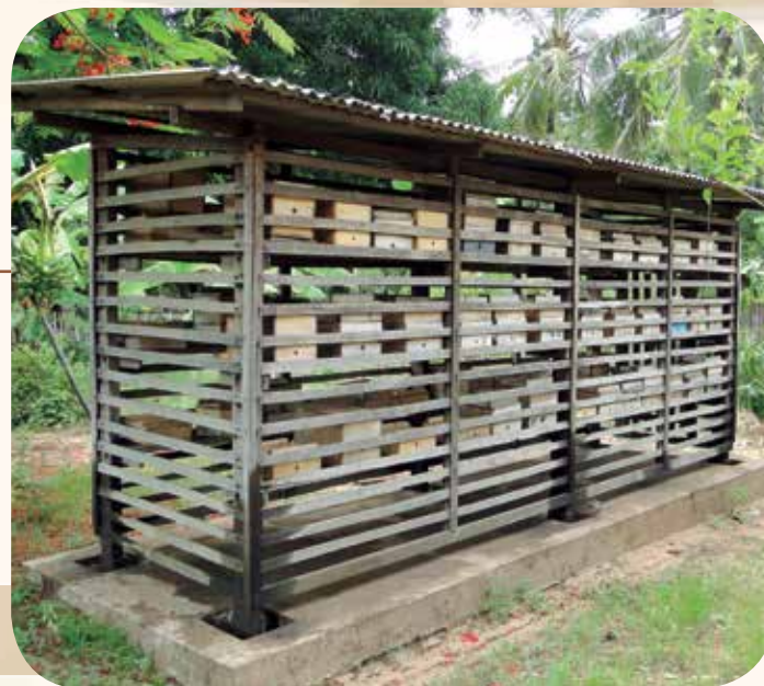
Figura 10: Meliponário em madeira com proteção para evitar furto e acesso de animais predadores

Como as abelhas-sem-ferrão possuem uma natureza dócil, um dos itens a ser observado na instalação do meliponário é segurança para evitar furto. O local deve ser limpo, sombreado, protegido de vento e de fácil acesso (Figura 10).