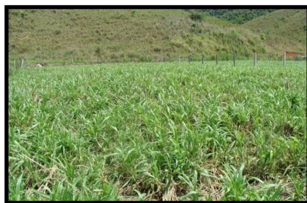
Figura 1. Pasto no início da rebrotação após pastejo uniforme

Períodos de ocupação intermediários, de 2 ou 3 dias, podem conciliar as vantagens apontadas para os dois extremos. Não existe uma recomendação geral para o uso de um ou outro período de ocupação e a decisão de qual utilizar vai depender de fatores como o nível de intensificação desejado, capacidade de investimento do produtor, da gramínea utilizada, do nível de produção das vacas e do nível de suplementação adotado, dentre outros.