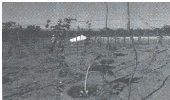
Figura 1. Pomar cultivado com o macujazeiro em área de produtor do município de Petrolina, PE

A quantidade de água disponível na cisterna para uso nas fruteiras e, ou hortaliças também foi item abordado pela pesquisa. Por um lado, 67% afirmaram que a produção ocorre durante todo ano; no entanto, 51% das famílias afirmam que a água armazenada na cisterna (52 mil litros) não é suficiente para aplicar às culturas durante o ano. Este mesmo percentual de famílias (51%) afirmou que a cisterna recebe água de outras fontes por meio de carro-pipa. Esta afirmação pode estar associada à concepção do programa P1+2, em que pode ter sido criada expectativa nas famílias de que a cisterna de produção poderia produzir para o mercado, fazendo com que muitas famílias excedessem no número de fruteiras dos pomares e dos canteiros das hortaliças. Em algumas destas famílias, foi observado até 100 pés de maracujazeiros por família, visando à comercialização dos frutos (Figura 1).