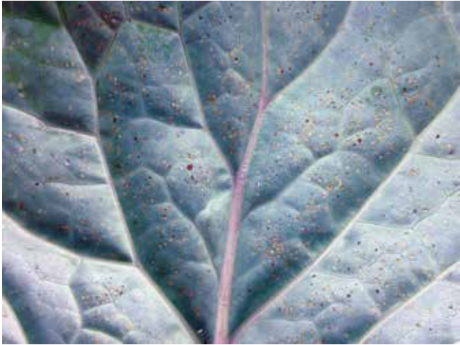
Figura 12. Mosca-branca – Bemisia tabaci biótipo B (ninfas).