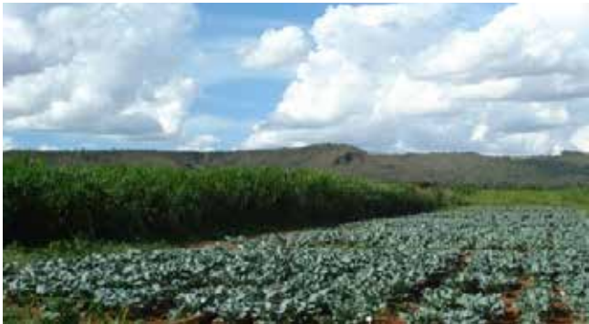
Figura 20. Barreira do tipo quebra-vento de capim-elefante.