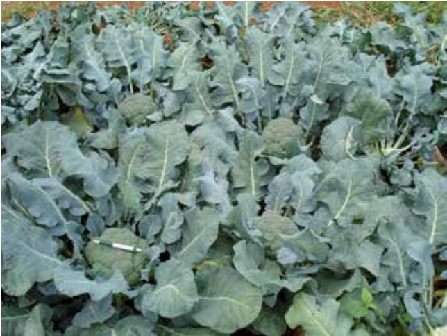
Figura 29. Inflorescências em ponto de colheita.

utilizam inflorescências de maior peso e diâmetro. Para congelamento, os floretes de comprimento (da base ao topo) possuem tamanho padrão entre 4 cm e 10 cm e são cortados em campo pelos produtores fornecedores localizados em menor distância ou na própria indústria, em condições higienizadas.