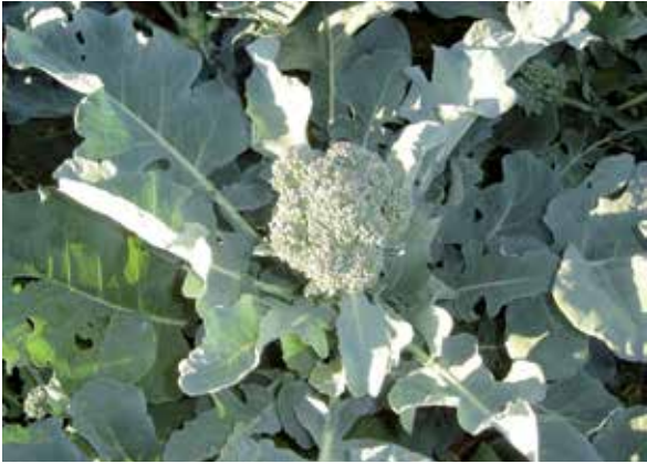
Figura 1. Brócolis do tipo ramoso: inflorescência central.