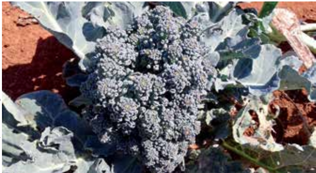
Figura 25. Roseta do tipo inflorescência única com a desordem denominada olho-de-gato.