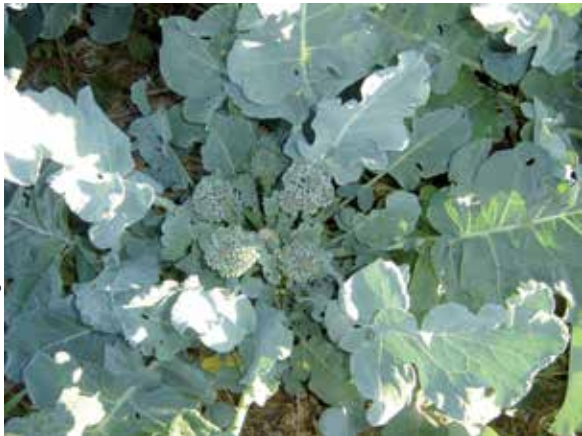
Figura 2. Brócolis do tipo ramoso: inflorescências laterais.