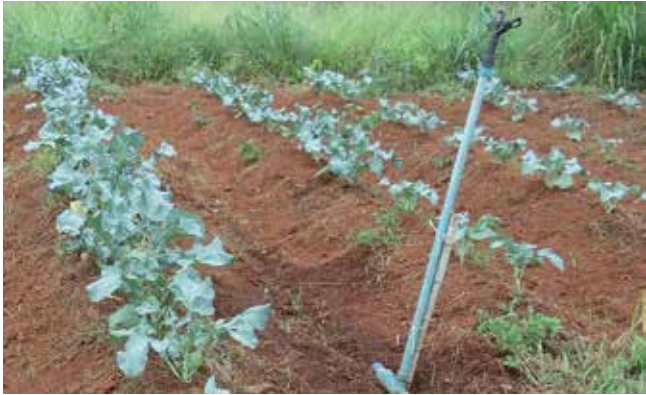
Figura 5. Plantio de brócolis em camalhões/leiras.

realizar o plantio em canteiros. As medidas geralmente são de 1 m ou 1,5 m de largura por 15 cm a 20 cm de altura. Os canteiros podem ser cobertos com mulching , tanto com plástico de cor preta, cinza ou prata, quanto com palha.