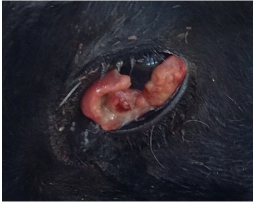
Figura 1: Foto de bovino com Carcinoma de Células Epidermoides Ocular (CCEO).

Cada criador ou profissional vinculado à raça Hereford deve receber um "kit de coleta" (Figura 2) composto por: frasco de plástico com formol tamponado para armazenar o tecido tumoral coletado, etiquetas de identificação do frasco, lápis para escrever na etiqueta (a etiqueta pode ser inserida dentro do frasco com formol, por isso deve ser identificada a lápis) e cartões de coleta de pelo (próprios / específicos para extração do DNA do animal), além do formulário de coleta de carcinoma e da ficha de registro.