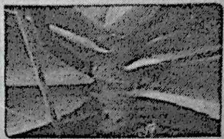
Figura 1. Visão do caule ereto e vertical de Phalaenopsis sp.

Orquídeas deste gênero são na sua maioria epífitas (plantas que vivem sobre árvores e arbustos, não sendo parasitas), com algumas classificadas como rupícolas (plantas que vivem sobre pedras e rochas), com crescimento tipicamente monopodial, ou seja, crescimento vertical sob uma base única.