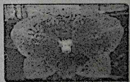
Figura 3. Flores com formato de borboleta