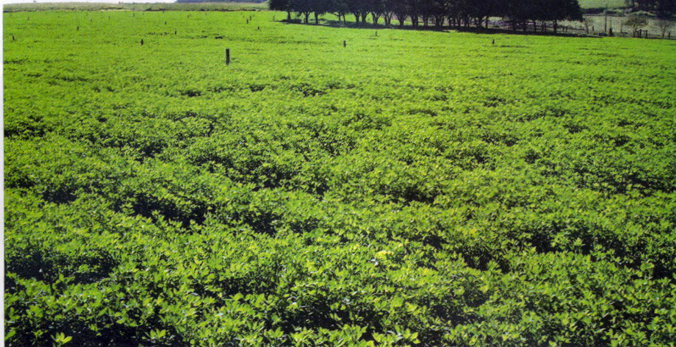
A qualidade da alfafa permite a substituição parcial ou total de concentrado proteico

Na outra situação, introduziu-se 7 ha com alfafa em pastejo no sistema tradicional, como única mudança proposta. Com a adoção dessa opção, a área com capim-tanzânia foi reduzida de 12 para 10