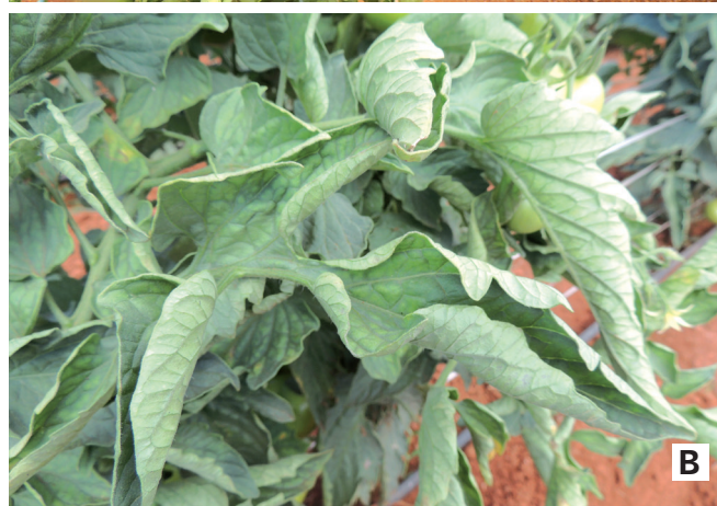
Figura 2. Tomateiro com sintomas de crinivirose. A - folhas do baixeiro com clorose entre nervuras e enrolamento foliar; B - folhas medianas com enrolamento e clorose entre as nervuras.