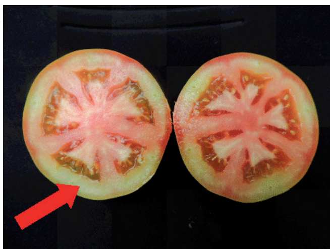
Figura 4. Fruto de tomate com amadurecimento desuniforme e isoporização da polpa. Seta indica a área do fruto com amadurecimento tardio ou irregular.