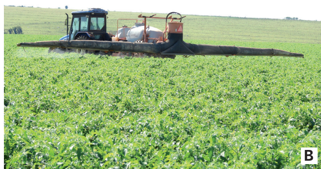
Figura 12. Aplicação de agrotóxicos mediante tecnologias de aplicação ajustadas ao segmento de produção de tomate: A - Pulverizador de barras com pingentes para emprego em tomateiro tutorado e B - Pulverizador de barras com assistência de ar para aplicações em tomateiro rasteiro para processamento industrial.