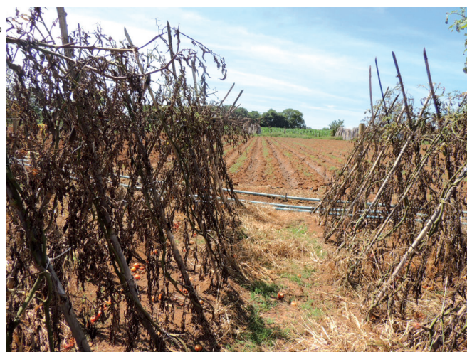
Figura 10. Cultivo de tomateiro estaqueado abandonado após a colheita.