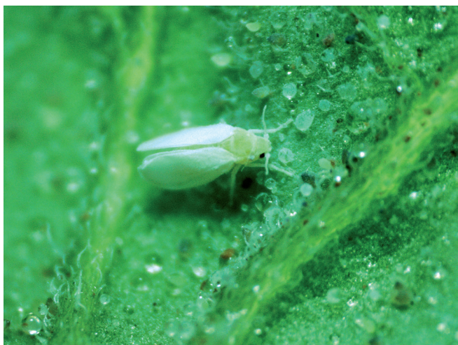
Figura 3. Adulto de mosca-branca, Bemisia tabaci .

As moscas-brancas podem se deslocar por longas distâncias carregadas por correntes de vento. Em geral, realizam voos altos durante a colonização de novas áreas e voos baixos entre plantas dentro do mesmo sistema agrícola, podendo se deslocar entre áreas em “nuvens” provenientes de cultivos vizinhos.