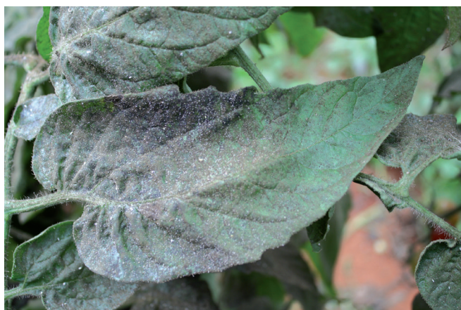
Figura 5. Folha de tomateiro com fumagina.