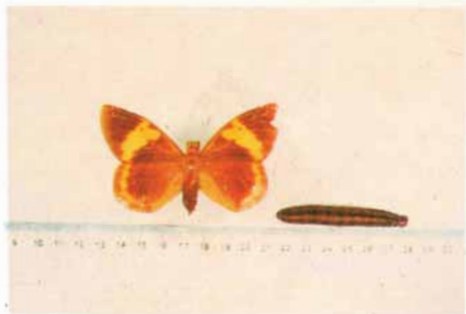
FIG. 11. Adulto e lagarta de Brassolis .

Brassolis - Brassolis sophorae ( Lepidoptera ): lagartas desfolhadoras de aproximadamente 80mm de comprimento (Fig.11), geralmente de coloração marrom-avermelhada com estrias longitudinais de cor marrom-clara. Vivem em grupo e se escondem, durante o dia, em ninhos construídos de vários folíolos unidos por espessa camada de teia. À noite, saem para alimentar-se com os folíolos das plantas.