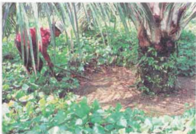
Fig. 4 - Coroamento.

tomar cuidado para não cortar ou danificar as folhas baixas do dendezeiro pois uma desfolha precoce na idade jovem retarda o crescimento e compromete o rendimento futuro da planta (Fig.5). O raio aproximado das coroas é de 1,5m nos primeiros anos, devendo ser aumentado na época de colheita.