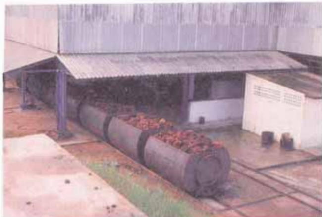
FIG. 16. Cachos sendo levados para o esterilizador.