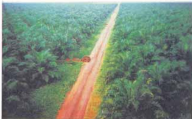
FIG. 15. Plantio comercial em franca produção da variedade Tenera.

No início, a produção é relativamente baixa (de 6 a 8 ton. de cachos/ha/ano), aumenta gradativamente até o oitavo ano, quando atinge o pique de produção (de 20 a 30 ton. de cachos/ha/ano), mantendo-se neste patamar até o décimo-sexto ano. A partir daí, declina ligeiramente até o final da vida útil comercial da plantação, que ocorre por volta dos vinte e cinco anos.