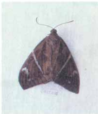
FIG. 10. Adulto da Castnia.

Para controlá-las, pulveriza-se o pedúnculo dos cachos com Triclorfon 80 PM, na base de 150g do produto comercial diluídos em 100 litros de água.