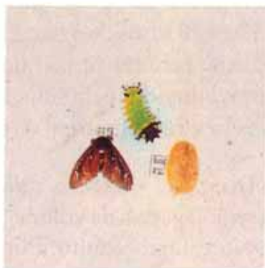
FIG. 9. Adulto, lagarta e pupa da Sibine.

Faz-se o controle químico dessa lagarta com aplicações de Carbaryl 85 PM,