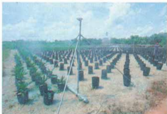
FIG. 3. Sistema de irrigação das mudas em viveiro.

com 20mm de espessura, contendo aproximadamente 28 furos de 5mm de diâmetro, no terço inferior. Sua capacidade é de 20 a 25kg de terriço.