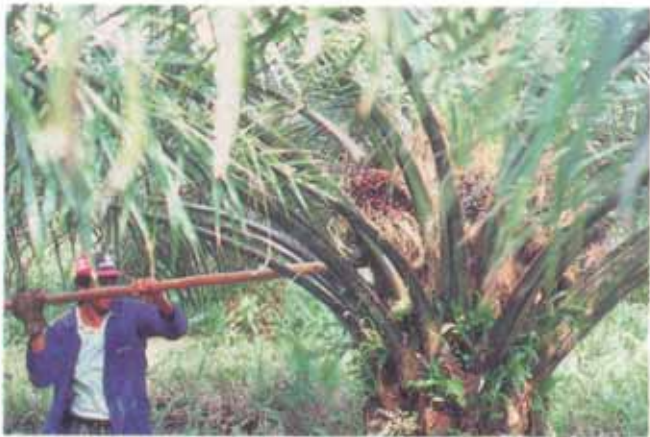
FIG. 12. Colheita com ferro de cova.

É uma tarefa de fundamental importância pois a maneira como é conduzida tem influência preponderante sobre o rendimento em óleo e qualidade do produto. Considerando que os frutos verdes contém menos óleo que os frutos maduros, que os frutos passados (pós-amadurecidos) possuem óleo com conteúdo mais alto de ácidos graxos livres e que, por outro lado, os ca-