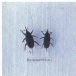
FIG. 6. Bicudo do coqueiro: macho e fêmea, adultos.

apresentam uma lista negra transversal. Tem hábito diurno e habita locais sombreados.