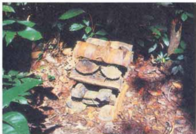
FIG. 7. Armadilhas de troncos de palmeira Bacaba.