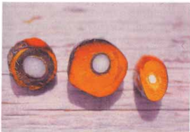
FIG. 1. Da esquerda para a direita, sementes de: Pisifera, Tenera e Dura.

-Tenera: a casca apresenta espessura inferior a 2mm e um anel de fibras ao seu redor. Esta variedade é obtida por meio do cruzamento das variedades Dura e Pisifera e, depois de selecionadas em campos de melhoramento, são vendidas como híbridos comerciais. Esta variedade é boa produtora de inflorescências femininas e, em consequência, de grande número de cachos, superando a variedade Dura.