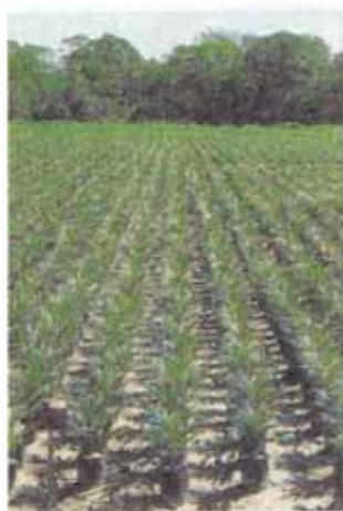
FIG. 2. Produção de mudas em viveiro.

Os sacos de plástico utilizados no viveiro são de cor preta, medem 40 x 40cm,