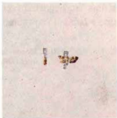
FIG. 8. Borboletas Sagalassa adultas.

Seu controle é feito pulverizando-se o solo, num raio de 50cm ao redor do tronco, com uma solução de Endosulfan, à base de 4g de ingrediente ativo (i.a.) por planta, diluído em um litro de água. O controle efetivo exige três pulverizações anuais.