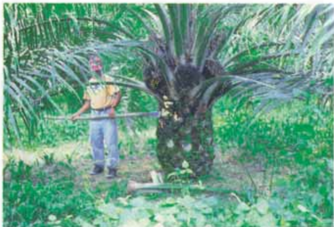
Fig. 5 - Poda das folhas.

A frequência dos coroamentos varia de acordo com as condições climáticas locais. É determinada pelo nível de infestação das ervas daninhas e pela rapidez do crescimento da planta de cobertura. Em condições climáticas mais favoráveis, sem déficit hídrico, são necessários, nos primeiros anos, cinco coroamentos na época mais chuvosa e três no período menos chuvoso, totalizando oito coroamentos por ano.