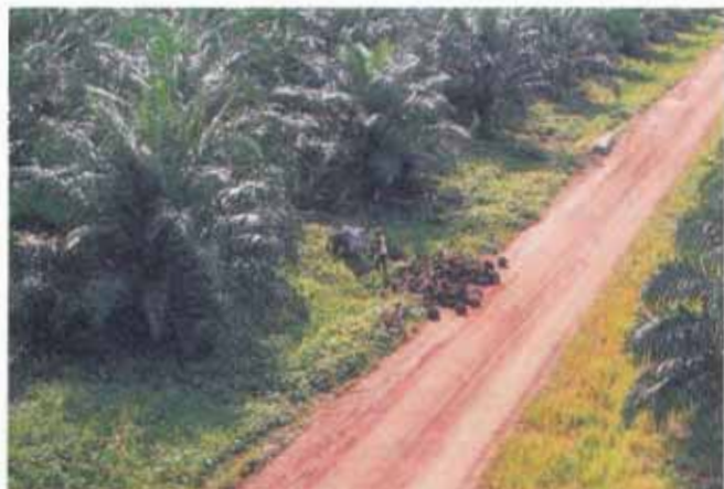
FIG. 13. Transporte dos cachos usando animal (burro).