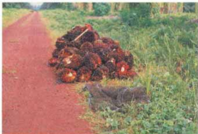
FIG. 14 - Amontoa à beira da estrada.