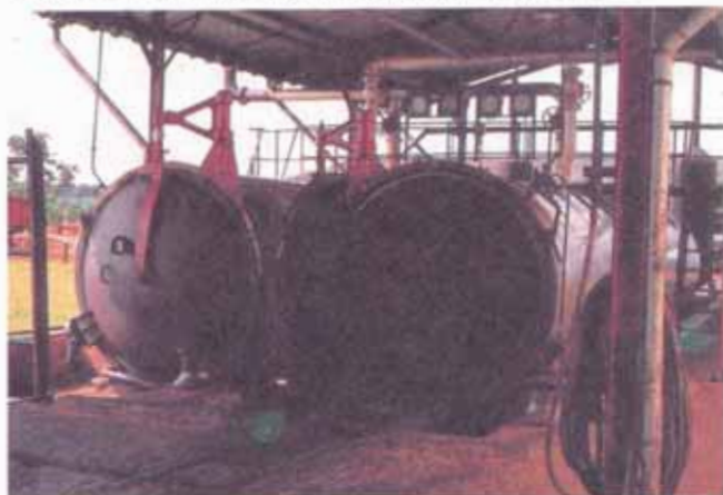
FIG. 17. Esterilizador.