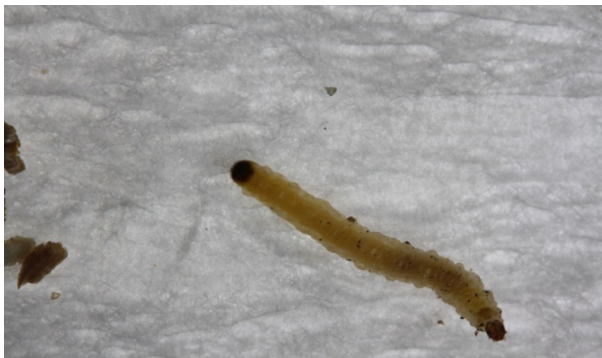
Figura 2. Larva de Diabrotica speciosa

D. speciosa apresenta três instares larvais, sendo o período de desenvolvimento das fases imaturas (ovo, larva, pré-pupa e pupa) variável em função da temperatura e da dieta empregada para sua criação (HAJI, 1981; MILANEZ, 1995). O ciclo de vida dura de 24 a 40 dias, sendo ovo de 5- 7; larva de 14- 26; e pupa 5-7 dias (ZUCCHI et al., 1993) (Figura 4).