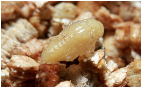
Figura 3. Pupa de Diabrotica speciosa

As pupas apresentam 5 mm de comprimento (Figura 3), são brancas e ficam protegidas numa câmara pupal logo abaixo da superfície do solo (FERREIRA; BARRIGOSI, 2006). Segundo Milanez e Parra (2000) os adultos de D. speciosa manifestam preferência por áreas onde o solo é mais escuro e permanece por mais tempo umedecido para realizar a oviposição e é onde a sobrevivência das larvas é maior, sendo elas rizófagas.