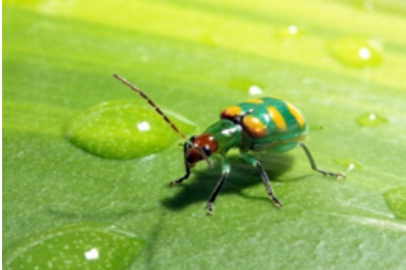
Figura 1. Adulto de Diabrotica speciosa .

D. speciosa apresenta três instares larvais, sendo o período de desenvolvimento das fases imaturas (ovo, larva, pré-pupa e pupa) variável em função da temperatura e da dieta empregada para sua criação (HAJI, 1981; MILANEZ, 1995). O ciclo de vida dura de 24 a 40 dias, sendo ovo de 5- 7; larva de 14- 26; e pupa 5-7 dias (ZUCCHI et al., 1993) (Figura 4).