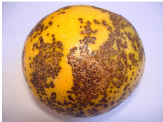
Figura 3. Detalhe de um fruto de laranja doce com sintomas de pinta-preta.