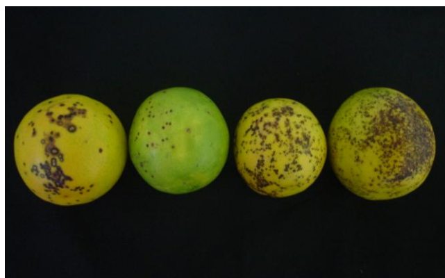
Figura 2. Sintomas de pinta-preta observados em frutos de laranja doce.

Para tanto, procedeu-se o isolamento direto e indireto do patógeno em meio de cultura. Após 15 dias, estes foram repicados para tubos de ensaio contendo o mesmo meio (DHINGRA; SINCLAIR, 1995). Os esporos produzidos foram identificados por meio de chaves de identificação taxonômica.