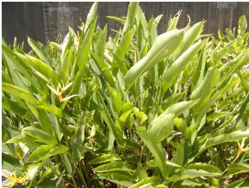
Fig. 2. Plantas de Heliconia sp. livres dos sintomas de sigatoka negra, no campo experimental da Embrapa Amazônia Oriental.