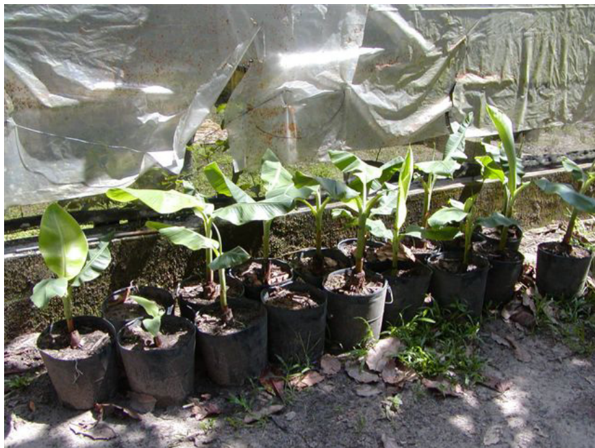
Fig. 1. Mudras rebrotadas de rizoma aclimatado (cultivar Garantida) provenientes de Manaus, AM, sem sintomas de Sigatoka negra .

Rizomas originais provenientes de Manaus (cultivar Garantida), com folhas rebrotadas, ainda encontram-se na área de viveiro da Embrapa e podem ser observados quanto à sua sanidade pelos órgãos competentes. Após a retirada de mudas para instalação dos experimentos, as folhas que brotaram encontram-se limpas, sem manifestação de sintomas de sigatoka negra (Fig. 2), fato que exclui a possibilidade de introdução da doença via rizoma.