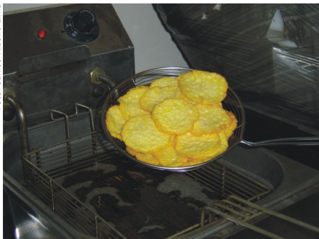
Figura 7. Chips de caju.