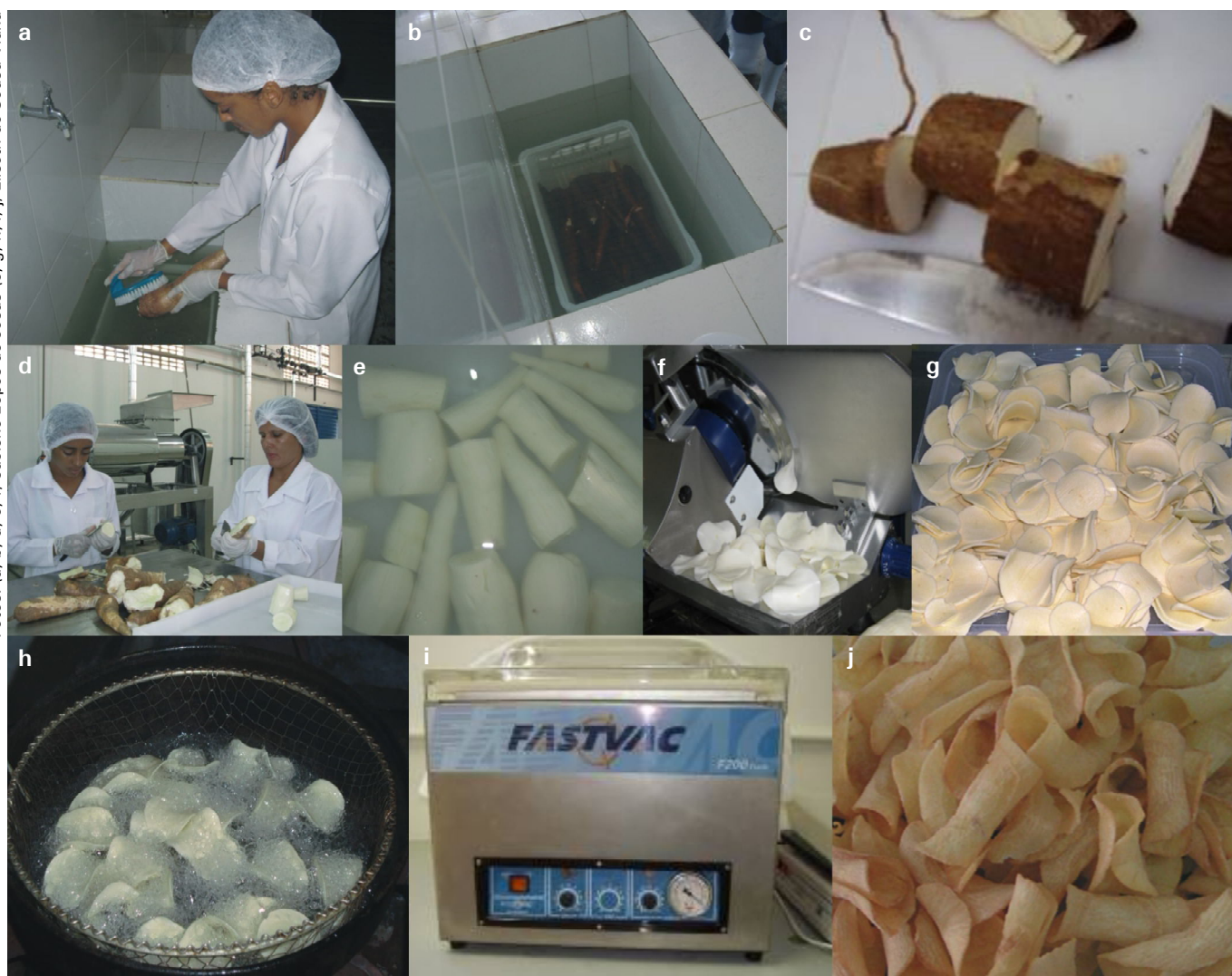
Figura 2. Etapas do processamento dos chips de mandioca: (a) lavagem, (b) sanitização (200 ppm de cloro ativo por 15 minutos), (c) corte em pedaços, (d) descascamento manual, (e) lavagem das raízes descascadas, (f) corte em fatias, (g) fatias, (h) fritura, (i) selagem e (j) chips de mandioca.