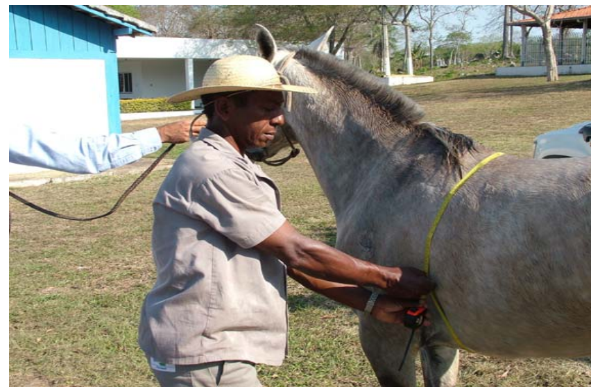
Figura 1. A medida do perímetro torácico é feita com o auxílio de uma trena ao nível da cilha (atrás da cernelha).

Por meio do valor em centímetros da medida do perímetro torácico é só fazer a interpolação deste valor na curva abaixo curva de peso (kg) e perímetro torácico (per_tor, cm) de cavalos Pantaneiros de diferentes idades (Figura 2) ou associar o valor mais próximo conforme Tabela abaixo: