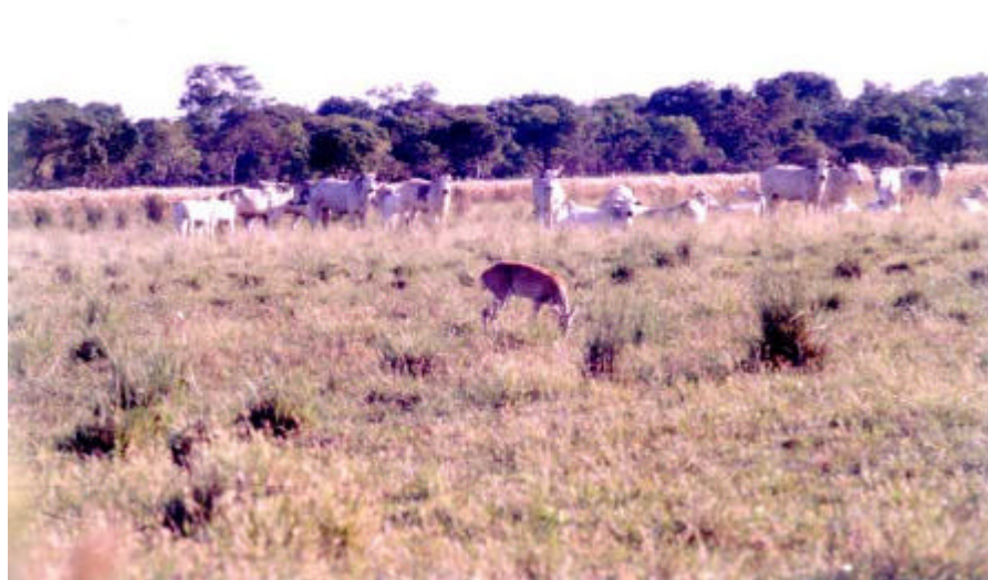
Foto 3 – No Pantanal, os bovinos vivem em conjunto com os grandes

herbívoros silvestres, como o veado campeiro.