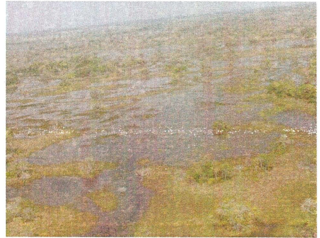
Área permanentemente inundada pelo Arrombado do Caronal

Na fase seca, há novamente todo o crescimento da vegetação terrestre nas áreas anteriormente alagadas, fertilizadas parcialmente no processo de inundação e parcialmente, pela decomposição da vegetação aquática da fase anterior. Dessa forma, o sistema consegue incorporar e aproveitar matéria orgânica de forma muito eficiente, explicando a riqueza e diversidade