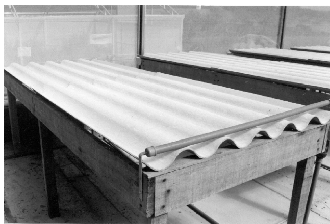
Figura 1. Plataforma em telha de fibrocimento.

O sistema baseia-se em uma plataforma constituída de telhas de fibrocimento, assentadas sobre suportes de madeira (basicamente esteios cravados no solo, ligados por caibros ou longarinas), que conferem à estrutura uma declividade de 4% (Figura 1). As telhas com largura padrão de 1,10 cm, e comprimento adequado a estrutura a ser montada, apresentam canais de 6 cm de altura e espaçados de 18 cm (distância entre dois pontos médios).