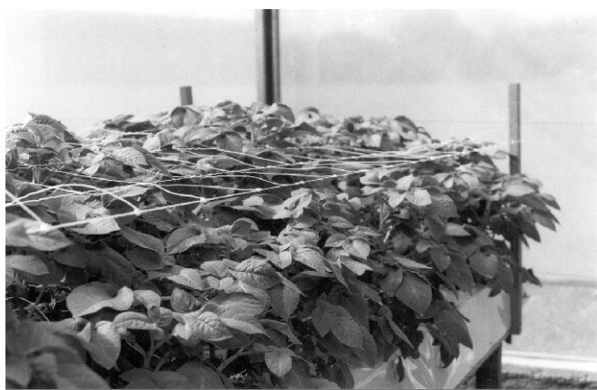
Figura 5. Tutoramento com rede.