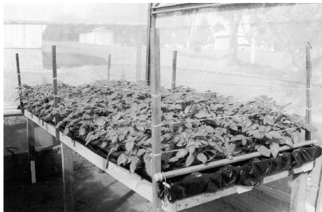
Figura 4. Tutoramento com fio de rafia.