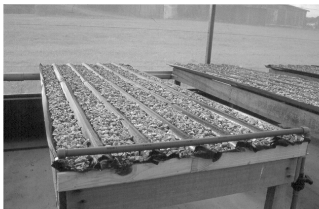
Figura 2. Telha de fibrocimento recoberta com filme de polietileno, e com camada de brita preenchendo parcialmente os canais.

Os canais da telha são revestidos com um filme de polietileno, cuja espessura não deve ser inferior a 150 micra, o que objetiva prevenir qualquer reação indesejável dos nutrientes da solução com o material constitutivo da telha, além de evitar seu encharcamento. Uma camada de granito fragmentado (brita) de tamanho médio, preenche parcialmente os canais da telha, auxiliando na sustentação das plantas (Figura 2).