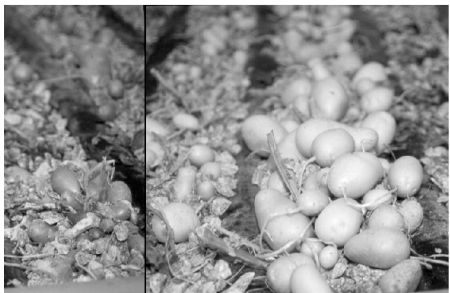
Figura 6. Tubérculos durante a colheita.