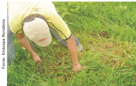
Corte do capim

Toda a forragem (inclusive as invasoras) encontrada dentro do quadro deve ser cortada com um cutelo ou tesoura de jardineiro.