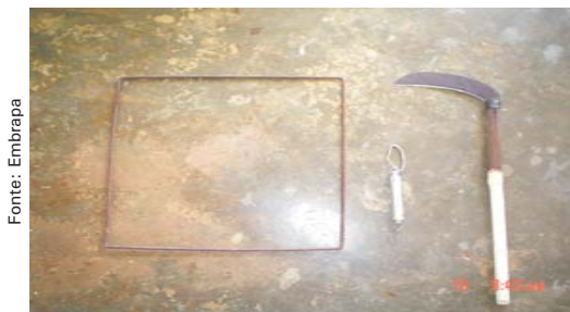
Material para a coleta de amostras de capim

vegetação mais uniforme. Quadros grandes (1,0 m x 1,0 m) são recomendados para áreas com vegetação pouco uniforme ou que apresentam solo descoberto.