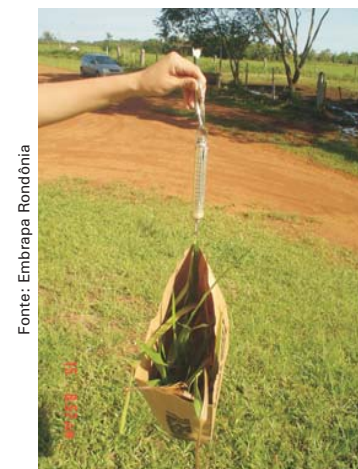
Pesagem da amostra

Após o corte do capim, o mesmo deve ser colocado em sacos de papel e pesado, o que pode ser feito no próprio campo. Se houver invasoras, as mesmas devem ser retiradas da amostra antes da pesagem. Dessa forma será obtido o valor de matéria original do capim. Desse material deve-se retirar uma subamostra de aproximadamente 500 g, a qual deve ser seca em estufa a 60°C/72 horas ou forno de microondas.