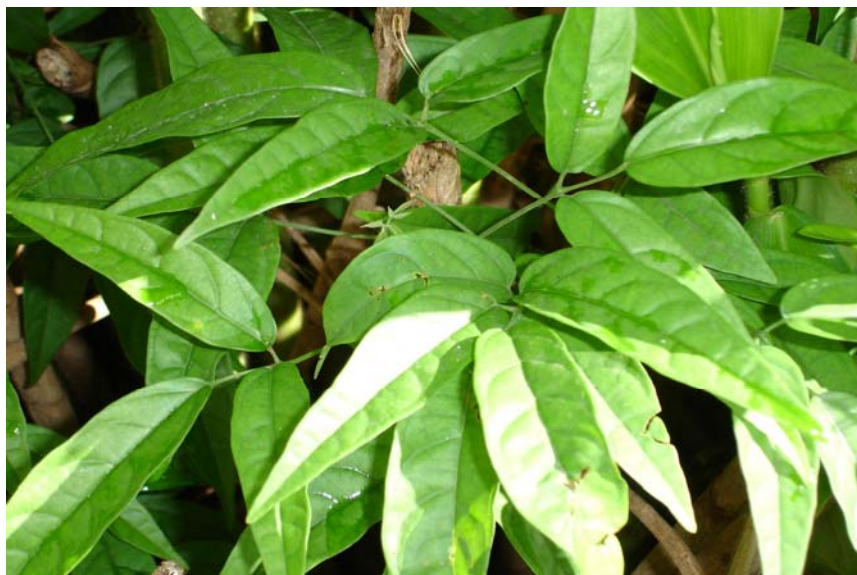
Fig. 1. Aspecto geral de folhas de Arrabidaea chica .