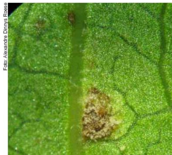
Fig. 1. Urédia de Phakopsora jatrophiicola em folha de pinhão-manso.

circundadas por um halo clorótico esmaecido (Fig. 1). Na face abaxial (inferior) das folhas, diametralmente oposto às lesões na parte superior, observava-se a presença de urédias, nas quais, ainda imersas, encontravam-se urediniósporos de cor marrom clara (Fig. 2).