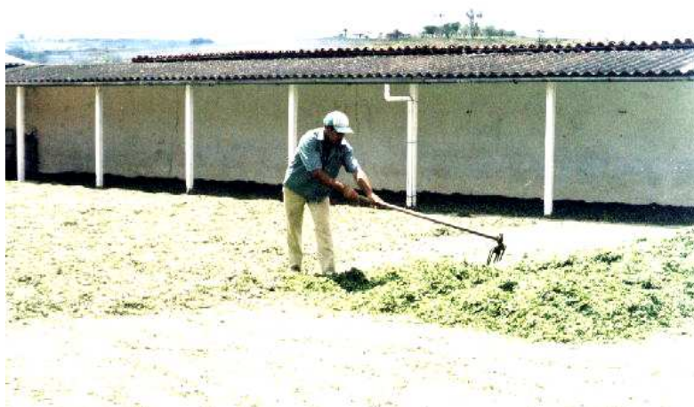
Figura 1 – Confecção de Feno de Sorgo – Agreste de Pernambuco.

Outras implicações são na pecuária, aumentando a oferta de forragem verde para bovinos, caprinos e ovinos, e de matéria prima destinada à cama de aviário (Figura 1).