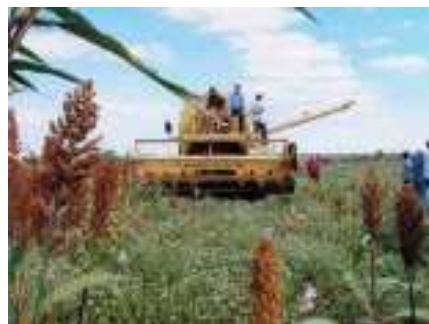
Figura 3 - Colheita mecanizada do sorgo granífero.

A tecnologia se enquadra no objetivo estratégico “Competitividade e Sustentabilidade do Agronegócio” da Embrapa. O lançamento do projeto se deu no ano de 2003 e o início da adoção foi na safra 2003/2004.