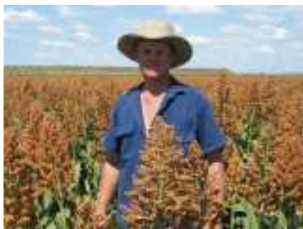
Figura 2 - Cultivo do sorgo granífero.