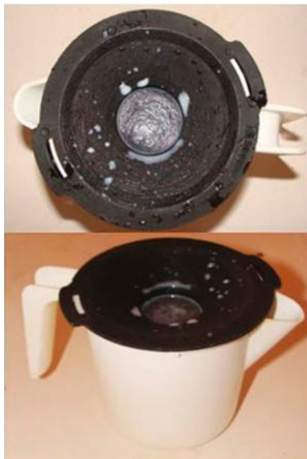
Fig. 1. Caneca telada ou de fundo escuro.

após ser misturado ao reagente; a reação se processa entre o reagente e o material genético das células somáticas presentes no leite, formando um gel, cuja concentração é proporcional ao número de células somáticas.