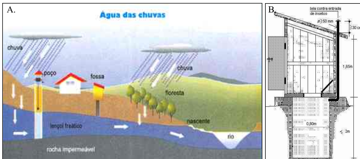
Fig. 1 - A. Fossa rudimentar mostrada em um contexto ambiental. B. Esquema de uma fossa rudimentar

Segundo dados do IBGE (2002), na área rural do Brasil há cerca de 32 milhões de habitantes, que em sua maior parte carecem de sistemas de saneamento básico. Aproximadamente 16 % dessa população possuem rede coletora de esgotos e/ ou fazem uso de fossas sépticas. Contudo, a grande maioria (41%) utiliza-se de fossas rudimentares, mais conhecidas como “fossas negras”, como solução final para o esgoto doméstico gerado (IBGE, 2004).