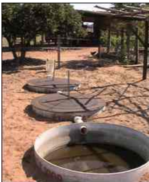
Fig. 4 – Sistema da fossa séptica biodigestora instalado na Fazenda Morro Verde – Itirapina/SP

A Fazenda Morro Verde localiza-se na cidade de Itirapina-SP. Nesta Fazenda, em abril de 2005, foi instalado no local um sistema da Fossa (Fig. 4), de caráter experimental, no qual substituiu-se o esterco de bovino usado como inoculante, por esterco de ovino (Santa Inês), visando avaliar e comparar a eficiência do processo de desinfecção. A casa onde foi instalado o sistema é habitada por 4 pessoas, dois adultos e duas crianças. O sistema recebeu esgoto somente do vaso sanitário. Foi utilizada uma quantidade de aproximadamente 10 L de esterco fresco, a cada 30 dias, a mesma prescrição utilizada para esterco de bovino. Esse experimento foi feito no intuito de atender as necessidades de tratamento de esgoto em propriedades rurais que não possuem criação de gado bovino, como freqüentemente, encontradas na região nordeste.