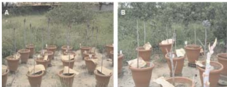
Fig. 3. (A) Plantas de mamona cultivadas à noite em câmara de crescimento, com elevada umidade relativa do ar; e (B) com temperatura noturna baixa.

Temperaturas muito altas também podem provocar perda da viabilidade do pólen, reversão sexual, havendo tendência a formação de mais flores masculinas (Figura 4) e outras mudanças fisiológicas que prejudicam a produção, enquanto temperaturas menores que 20 °C podem favorecer a ocorrência de doenças e até paralisar o crescimento da planta.