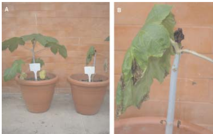
Fig. 2. (A) Efeitos da temperatura noturna elevada no metabolismo da mamona; e (B) com temperatura noturna baixa.