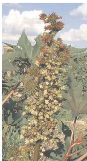
Fig. 4. Temperaturas elevadas, acima de 30 °C, promovem problemas de reversão de sexo.

Temperaturas muito altas também podem provocar perda da viabilidade do pólen, reversão sexual, havendo tendência a formação de mais flores masculinas (Figura 4) e outras mudanças fisiológicas que prejudicam a produção, enquanto temperaturas menores que 20 °C podem favorecer a ocorrência de doenças e até paralisar o crescimento da planta.