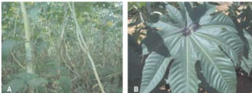
Fig. 1. (A) Mamona plantada em área não zoneada no município de Teresina-PI, com baixa altitude e solo muito fértil; e (B) crescimento exagerado das folhas.

Foi observado, nas condições climáticas de Teresina, PI, com altitude de 74 m, que as linhagens CNPAM 2000-73 e CNPAM 2000-47 apresentaram produtividades de bagas superiores a 1.000 Kg/ha e o componente de produção que mais influenciou no aumento da produtividade de sementes foi o número de racemos por planta (MELO et al. 2004a). Melo et al. (2004b), avaliando genótipos de mamona em baixa altitude, município de Teresina, PI, altitude de 74 m, obtiveram produtividades variando de 654 a 1.210 kg ha -1 , apresentando, também uma correlação positiva entre o número de racemos por planta e a produtividade de sementes de mamona. Neste local, as precipitações pluviais são boas ao longo do ano, e em solo adubado, como se estivesse no ótimo ecológico para a altitude, a produtividade varia muito mais.