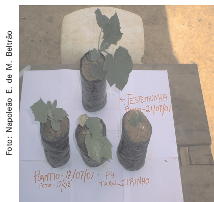
Fig.1. Bioensaio com pepino.