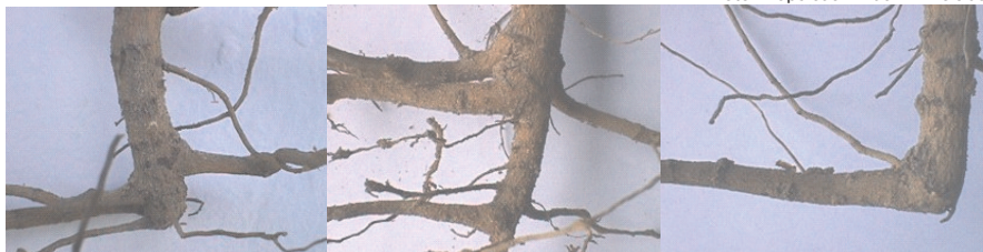
Fig. 3. Alterações ocorridas no sistema radicular do algodoeiro. Fazenda Busato II. Bom Jesus da Lapa, BA. 2001.