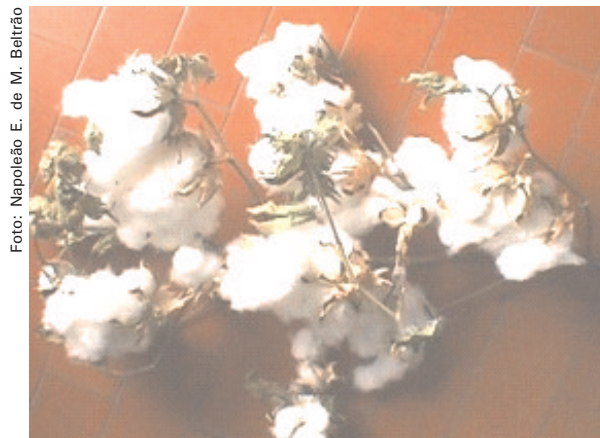
Fig. 4. Parte da planta do algodão, exibindo seus frutos. Fazenda Busato II. Bom Jesus da Lapa, BA. 2001.

do solo, requerendo monitoramento e avaliação constante (QUEIROZ et al. 1997) bem como da água (HOLANDA e AMORIM, 1997) e a recuperação do solo, quando necessário, via uso de lavagem e de agentes químicos, como o gesso ( \text{CaSO}_4 ) periodicamente (SANTOS e HERNANDEZ, 1997). Na verdade, é uma sintomatologia complexa, sendo uma síndrome, podendo estar envolvidos vários fatores bióticos (cultivar, ambiente edáfico etc) e abióticos, como os já colocados e comentados anteriormente. Com a redução do crescimento radicular em determinado momento do ciclo fenológico da cultura, devido à alometria do crescimento, bem como à forte demanda dos frutos (Figura 4) a planta entrou em crise energética, promovendo o ajustamento interno, apressando a senescência de parte de seus órgãos, e se iniciando pelas partes em crescimento de elevada demanda de metabólitos, como as regiões meristemáticas.