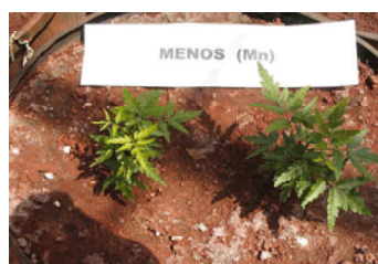
Fig. 12. Deficiência de manganês em solo de Cerrado.

Considera-se como disponível o \text{Mn}^{+2} trocável e o existente na solução do solo. Nessa, ao que parece, o Mn se encontra em sua maior proporção como complexo solúvel com ácidos orgânicos. O \text{Mn}^{+3} facilmente reduzido, chamada "ativo", também contribui para o disponível (Borket, 1991). O manganês é fundamental para a estrutura lamelar dos tilacóides dos cloroplastos. De acordo com Oliveira et al. (1996), os sintomas de deficiência de Mn não são muito comuns, mas, na ausência desse nutriente, observa-se um enrugamento das folhas mais novas. As plantas afetadas são geralmente pequenas, com caules delgados de coloração verde-pálido e folhagem amarelada (Figura 12).