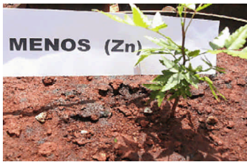
Fig. 13. Sintomas de deficiência de zinco.