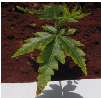
Fig. 7. Sintomas de deficiência de magnésio.

O magnésio é altamente móvel no floema e, portanto, na sua ausência, sintomas de deficiência manifestam-se sobremodo nas folhas mais velhas, formando áreas cloróticas tipicamente internervais (Figura 7). Nessa condição, há aumento nos teores de amido e de N não-protéico. Com a intensificação dos sintomas, os folíolos das folhas caem, persistindo o pecíolo por mais tempo.