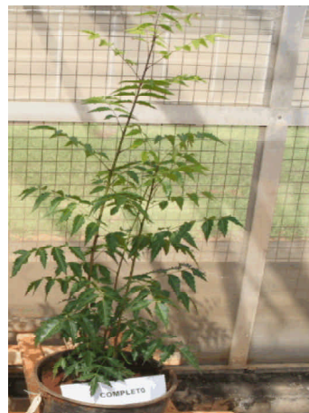
Fig. 2. Planta de nim desenvolvida em tratamento completo.