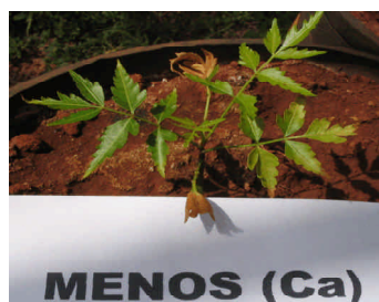
Fig. 6. Sintomas de deficiência de cálcio.

O Ca é importante para a estrutura das paredes celulares e também para a estrutura e função das membranas biológicas, afetando-lhes a permeabilidade, a seletividade e processos relacionados. É um elemento pouco móvel na planta. Os sintomas característicos da deficiência manifestam-se nas folhas mais novas. As plantas apresentam as folhas superiores coriáceas, quebradiças, encurvadas, com reduzido crescimento radicular e do caule (Figura 6). Os folíolos apresentam clorose internerval e as nervuras, no início dos sintomas, apresentam tonalidade amarelada, passando, em seguida, a confundir-se com a clorose geral do limbo. O broto terminal morre, e as plantas não alcançam o florescimento. Os sintomas iniciais da carência de cálcio manifestam-se por uma coloração verde-clara de todas as folhas da planta. As folhas mais velhas, além dessa coloração anormal, secam e caem em grande quantidade. Em contraposição, as folhas recém-nascidas apresentam coloração verde-clara, que é acompanhada pela morte das gemas apicais. Aplicado na forma de calcário, favorece a planta, corrigindo as propriedades físicas e químicas do solo (Miranda et al., 2005).