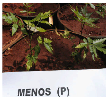
Fig. 4. Sintomas de deficiência de fósforo na folha do nim.

Na maioria das plantas, a deficiência de fósforo provoca sintomas nas folhas mais velhas, como manchas cloróticas irregulares, de coloração verde-limão (Figura 4). As folhas mais novas apresentam cor verde-azulada brilhante. Os sintomas manifestam-se inicialmente por uma mudança na coloração das folhas que, da cor verde natural, passaram a ter a coloração verde intensa, quase azulada. Com a acentuação dos sintomas, a cor das folhas mais velhas progride para amarelo-castanho, dos bordos para o centro do limbo (Malavolta, 1980). Em seguida, folhas mais velhas secam e caem, restando poucas folhas nas plantas. As plantas têm o número de folhas e área foliar reduzidos, apresentando, ainda, caimento prematuro das folhas.