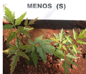
Fig. 8. Sintomas de deficiências de enxofre.

presente em vários adubos formulados. As plantas deficientes em enxofre apresentam crescimento aparentemente normal, tanto da parte aérea como do sistema radicular. Os sintomas característicos iniciam-se pelas folhas mais novas, na forma de manchas irregulares, verde claras, distribuídas no limbo dos folíolos (Figura 8). Contudo, em certas espécies, a clorose aparece simultaneamente, tanto em folhas velhas quanto nas mais novas. Com o desenvolvimento das plantas, as folhas tornam-se amarelas, e os folíolos caem facilmente. A correção de áreas carentes em enxofre, onde se necessita aplicar calcário, é realizada através da aplicação de gesso, em quantidades equivalentes a 20 a 40% em gesso, do calcário recomendado.