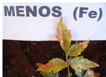
Fig. 11. Sintomas de deficiência de ferro.

em razão da inibição da síntese de clorofila. O teor de ferro em folhas deficientes pode apresentar grandes variações, embora 50 \text{ mg/dm}^3 (ppm) seja considerado o nível crítico foliar (Wilcox & Fageria, 1976).