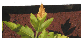
Fig. 5. Sintoma de deficiência de potássio em folha de nim.

Muitos solos apresentam teores menores que 50 mg/dm 3 , considerados críticos para algumas culturas. As culturas que recebem adubação potássica pesada apresentam plantas vigorosas e firmes, atribuindo ao elemento certo controle de pragas, doenças e tolerância a baixas temperaturas (Andriolo et al., 2003).