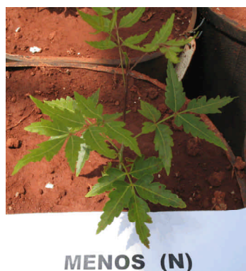
Fig. 3. Sintomas de deficiência de nitrogênio na planta de nim indiano.