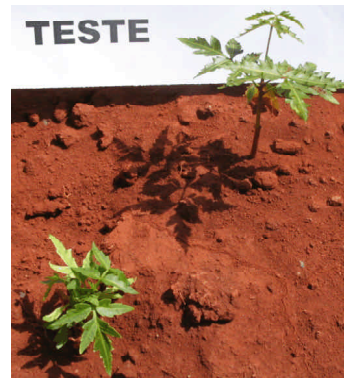
Fig. 1. Tratamento testemunha; desenvolvimento do nim indiano em solo do Cerrado brasileiro sem corretivo do solo e sem fertilizante.

Plantas desenvolvidas em solos onde ocorrem deficiências de muitos nutrientes, como no Cerrado, germinam mas dificilmente continuam seu desenvolvimento (Figura 1). O potencial de uma planta bem nutrida pode ser observado desde ao início de seu cultivo (Figura 2).