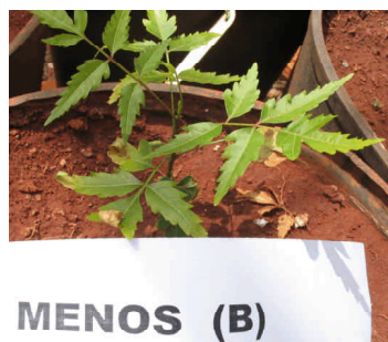
Fig. 9. Sintomas de deficiência de boro.