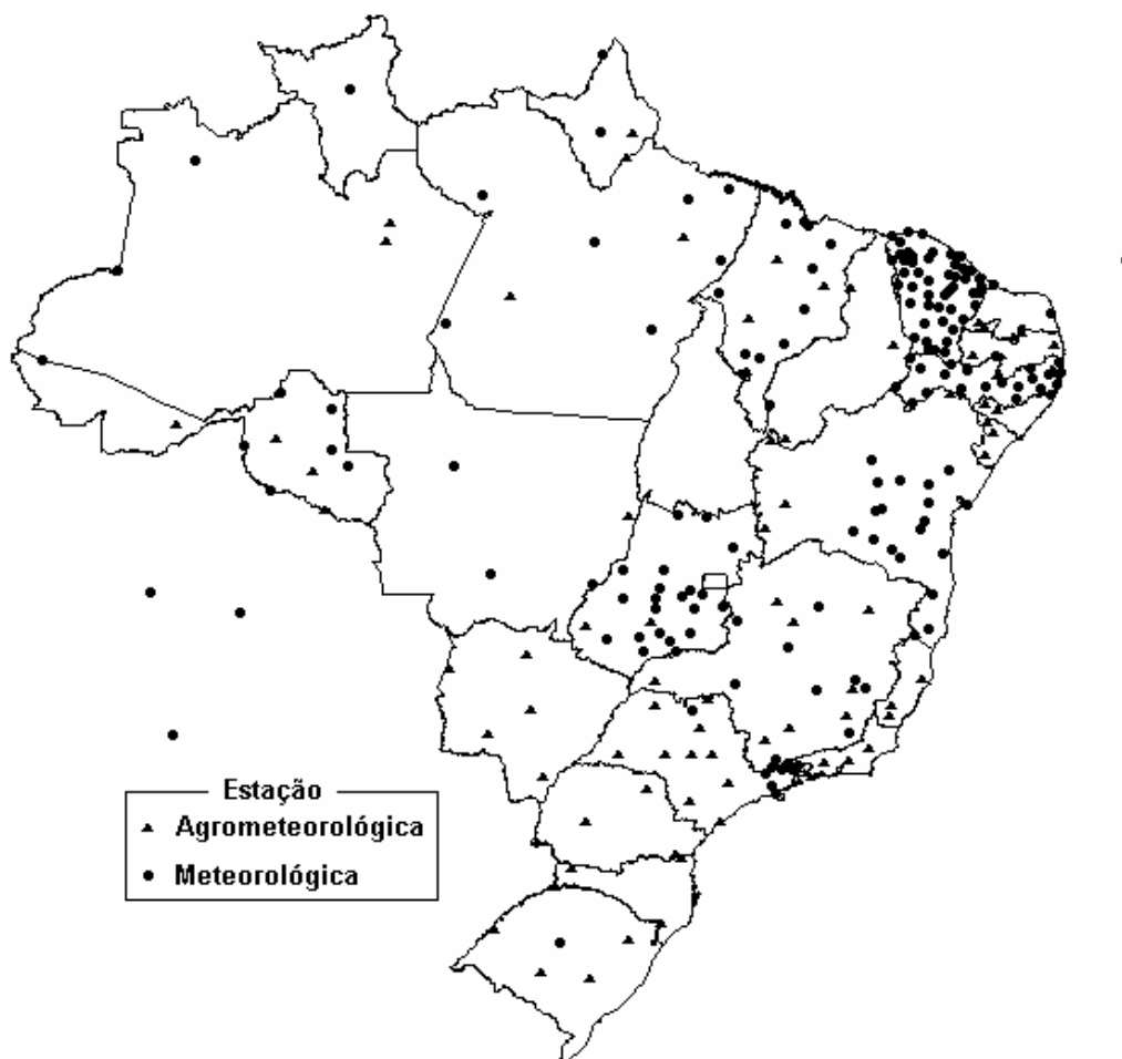
Figura 1 - Localização das 77 estações agrometeorológicas e 172 estações meteorológicas do INPE.