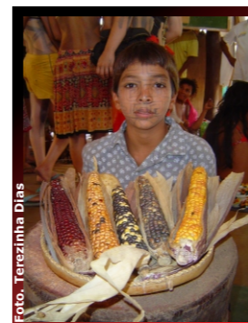
Figura 3. Milhos Krahô/Types of Krahô corn.