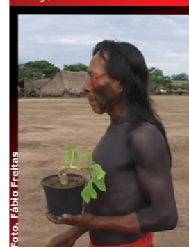
Figura 5. Entrega do cipó kupá /Handing over a kupá liana.