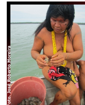
Figura 6. Soltura de filhotes de Tracajá/Releasing young Tracajá turtles.