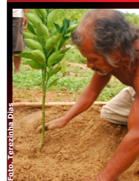
Figura 4. Plantio de fruteiras em aldeia Krahô/Orchard in a Krahô village.