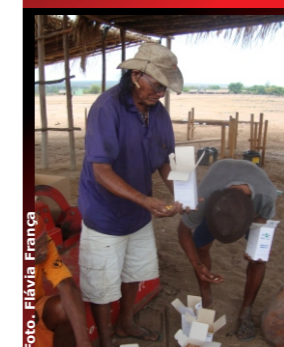
Figura 7. Milho tradicional povo Xavante/Traditional corn Xavante people