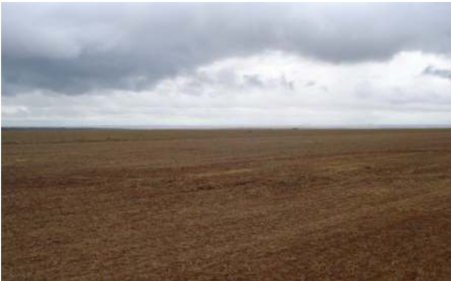
Figura 2. Vista de área onde a soja já foi colhida, estando pronta para a semeadura do algodoeiro em janeiro. Campo Verde, MT.