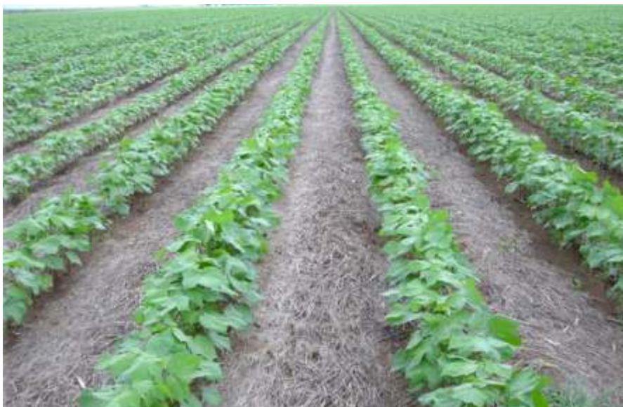
Figura 4. Algodoeiro cultivado sobre palhada de Urochloa ruziziensis . Sorriso, MT.

A Figura 5 mostra uma área onde anteriormente foi feito o cultivo do algodoeiro e na sequência foi semeada soja em SPD. Um detalhe negativo mostrado na Figura 5 é a pequena quantidade, ou até mesmo a ausência, de palha na superfície do solo.