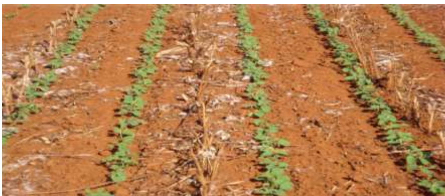
Figura 5. Soja cultivada em área anteriormente cultivada com algodão. Chapadão do Sul, MS.