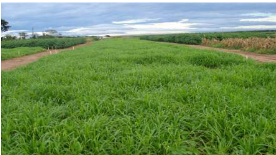
Figura 7. Urochloa ruziziensis cultivada solteira em área anteriormente cultivada com soja. Primavera do Leste, MT.