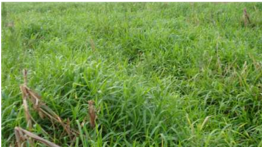
Figura 6. Urochloa ruziziensis cultivada em consórcio com milho de segunda safra, para aporte de palha ao sistema de produção. Primavera do Leste, MT.