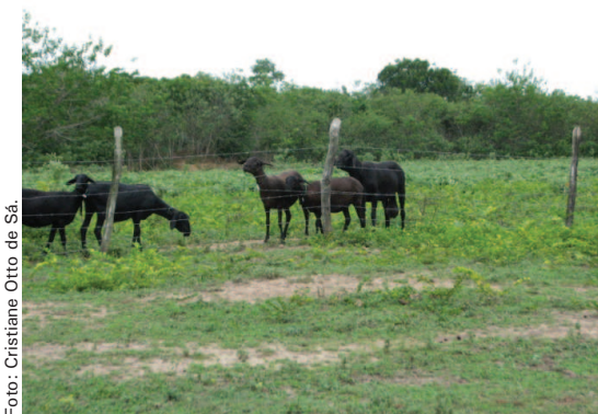
Figura 4. Ovelhas deslançadas com reprodutor Santa Inês na estação de monta em Nossa Senhora da Glória, SE; região semiárida no Nordeste do Brasil.

Os resultados apresentados nas Figuras 1 e 3 são importantes para a definição do manejo que será realizado com o objetivo de reduzir a estação reprodutiva e concentrar os partos. A concentração de partos tem como vantagens: facilitar o manejo, formar lotes uniformes de cordeiros e facilitar o trabalho em programas acelerados de parições. No entanto, se a estação reprodutiva não for bem definida e conduzida, pode ocorrer uma redução na fertilidade do rebanho e/ou um aumento na mortalidade de cordeiros, por nascerem em uma época desfavorável quanto à alimentação ou, ainda, por não receberem um manejo adequado por causa da mão-de-obra não preparada para atender vários partos em um único dia.