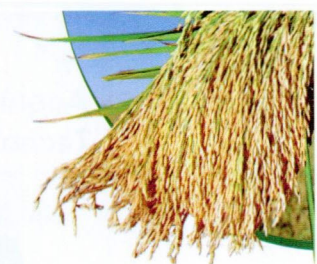
Média de grãos inteiros de acordo com ponto de colheita

Recomendada para os estados de GO, MA, MG, MT, PA, PI, RO, RR e TO.