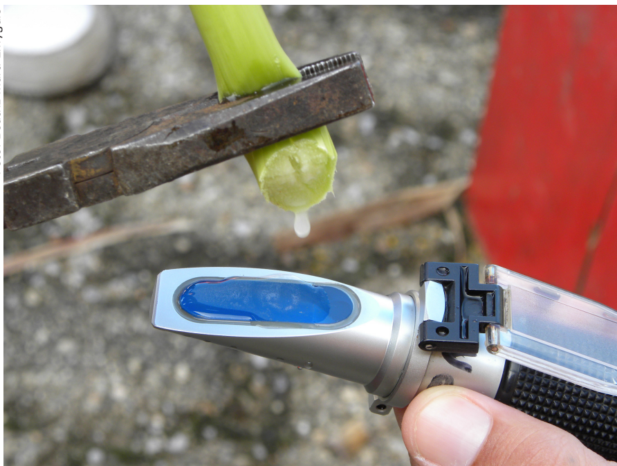
Figura 2. Determinação de sólidos solúveis totais (Brix) em plantas de sorgo sacarino, com leitura direta em refratômetro. Embrapa Clima Temperado, 2011