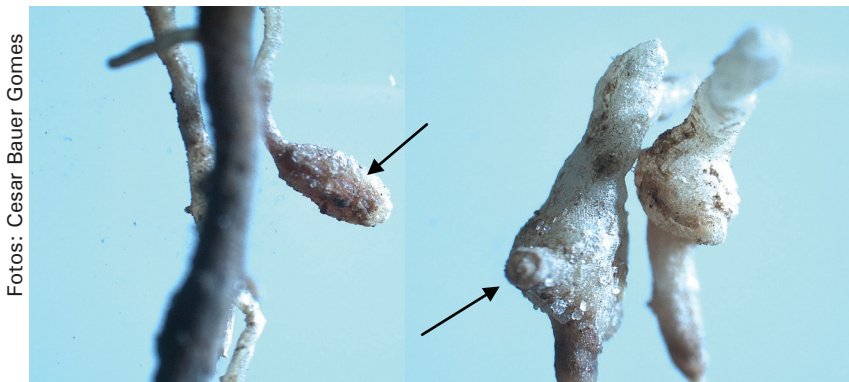
Figura 2. Raízes de cana-de-açúcar com galhas causadas por Meloidogyne javanica .

Na Figura 2, pode-se notar a presença de galhas em raízes de cana parasitadas por M. javanica . De acordo com Moura et al., (1990; 2000) esses patógenos de solo parasitam o sistema radicular da cana, debilitando-a, o que reduz a capacidade da planta de absorção d'água e nutrientes, acarretando, conseqüentemente, na redução da produtividade agrícola de áreas infestadas. Considerando-se que M. javanica e M. incognita Kofoid e White, 1949 são consideradas as espécies do nematóide das galhas mais frequentes em canaviais brasileiros, e que altos índices populacionais dessas espécies podem afetar a produtividade (BARROS et al., 2005), medidas de controle devem ser tomadas com o intuito de minimizar os danos causados por estes nematoides na cultura (DIAS-ARIEIRA et al., 2010). Assim, a detecção de níveis populacionais elevados de M. javanica encontrados em pelo menos dez genótipos de cana da área amostrada, (Tabela 1) indica a suscetibilidade desses materiais à praga.